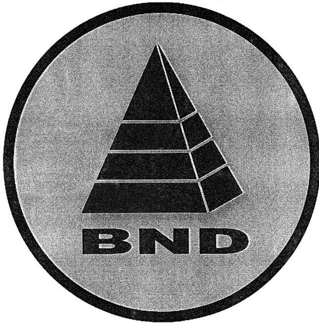
SEMNULE ELECTORAL al Blocului Național Democrat