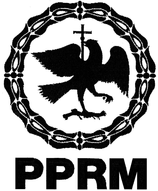
SEMNULE ELECTORAL al Partidului Popular România Mare