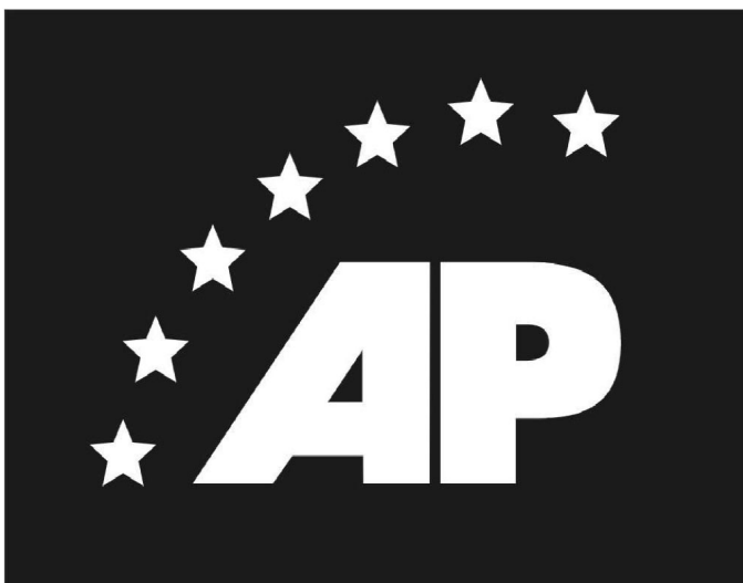
SEMNULE ELECTORAL al Acțiunii Populare