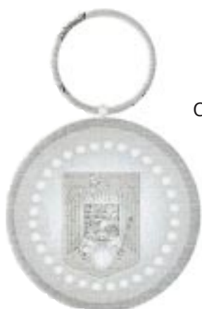
Clasa a II-a