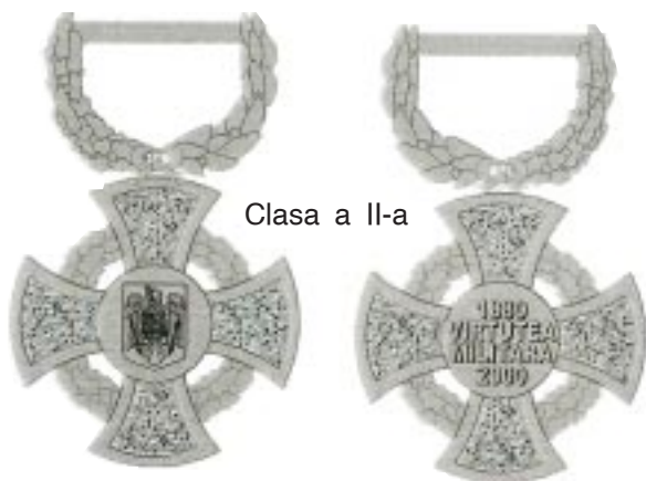
Clasa a II-a