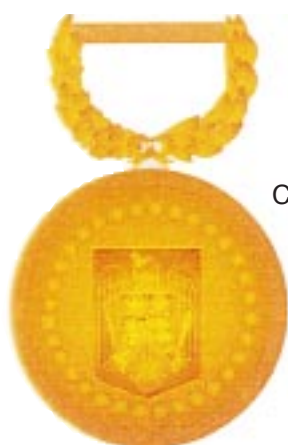
Clasa a III-a