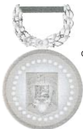
Clasa a II-a