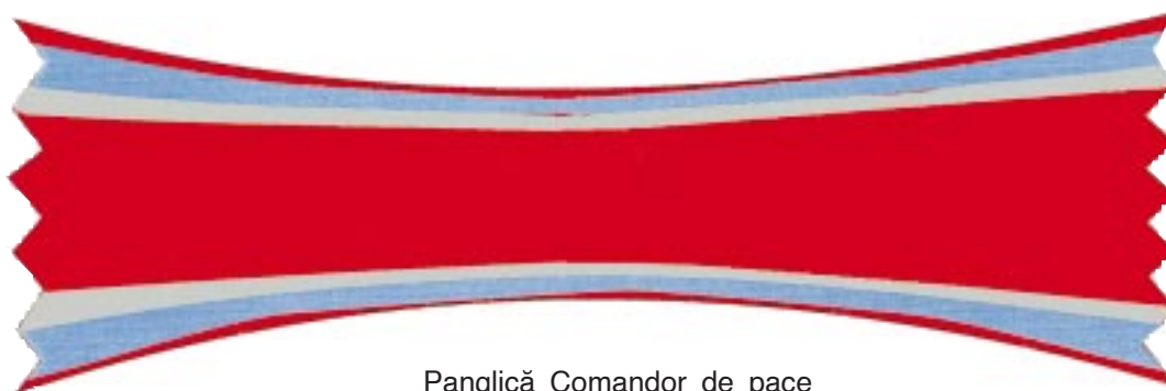
Panglică Comandor de pace