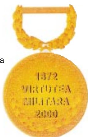
Avers — Revers