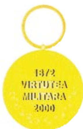
Avers — Revers