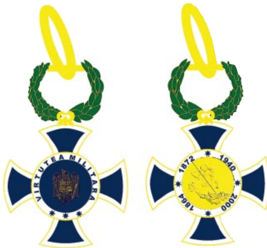
Avers — Revers