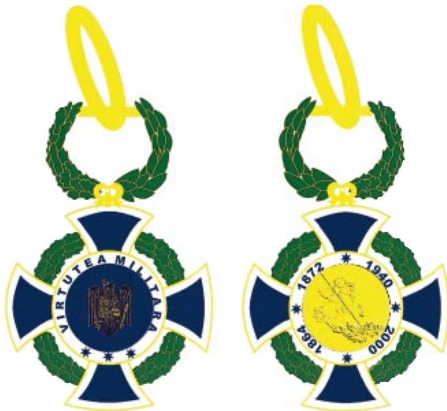
Avers — Revers