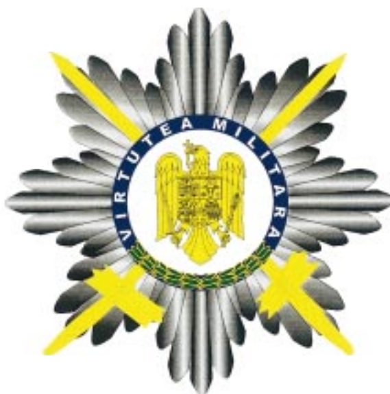
Bareta „de război“