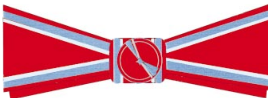
Fundă (papion) doamne Ofițer