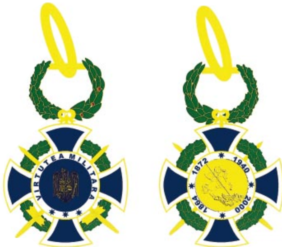
Avers — Revers