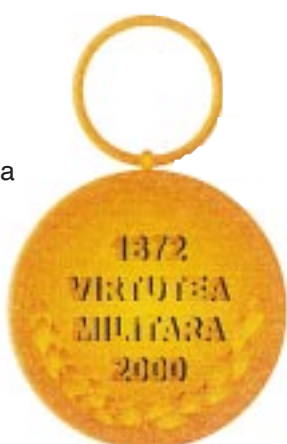
Avers — Revers