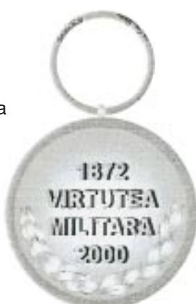
Avers — Revers