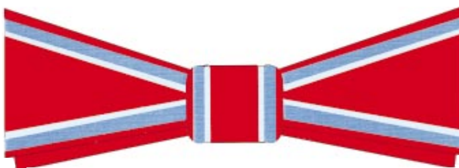
Fundă (papion) doamne Cavaler