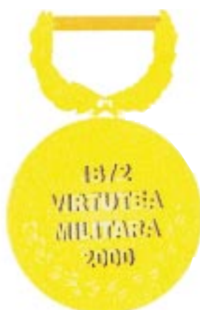
Avers — Revers