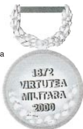
Avers — Revers