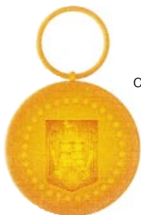
Clasa a III-a