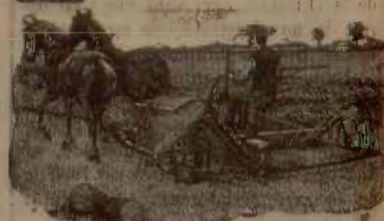
Model din anul 1895

SFOARA DE MÂNILĂ, de cea calitate pentru Secerători cu aparat de legat snopi