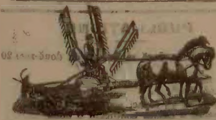
Model din anul 1895

Ultima perfecțiune, din fabrica JOHNSTON HARVESTER CO. Batavia (America)