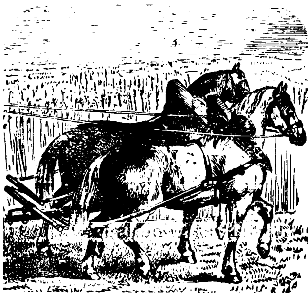
ARATRU (PLUG) CU CAI

Cultura grăului este d'o importanță cu atît mai mare în țerra noastră, cu cât ea constituie baza fundamentală a avuțiilor noastre, în comparație cu inferioritatea în care se află artele și industria.