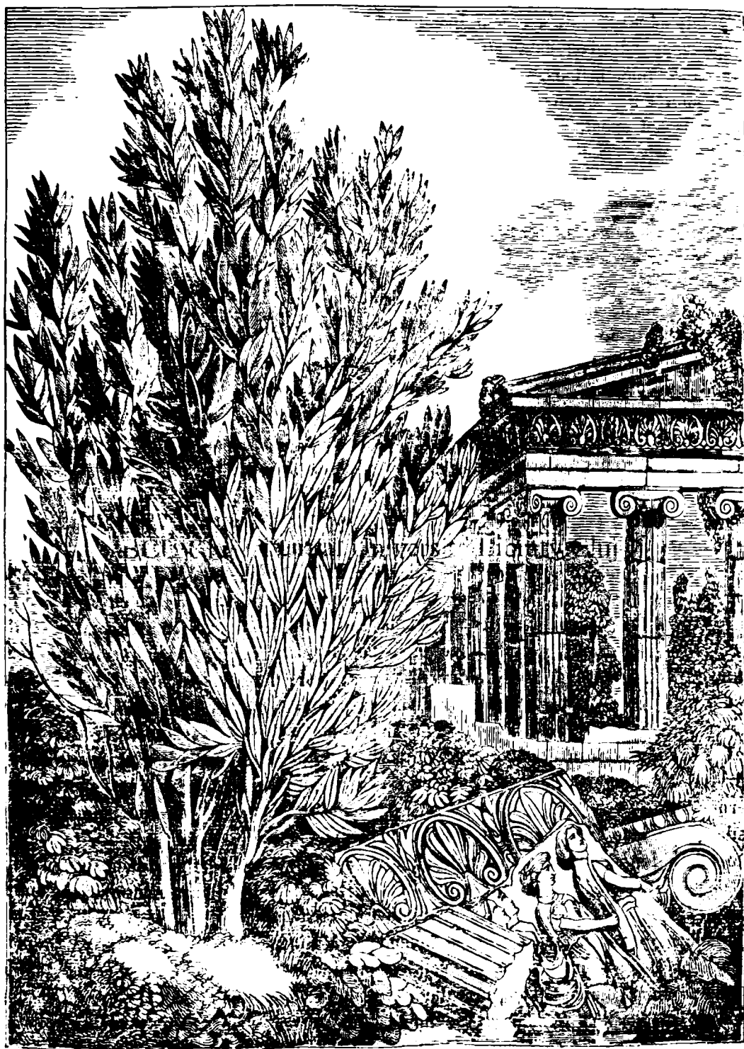
Арборѣ Давїс (Laurus, Laurier, Lorbeerbaum.)

сѣ'шї вїндече слѣбїчїзна аѣвїдїзней каре ре- | тїсней каре residz вн вѣртѣ ; саѣ ка сѣ'шї знгѣ sidz вн канѣ. саѣ сѣ баѣе аѣесте фї шї воавѣ | пїчїоаре ле кѣ знгѣ de dafinѣ kindѣ аре слѣбїчїзне вн stomaxѣ ка сѣ'шї вїндече слѣбїчїзна dїpes- | вн пїчїоаре. Eatѣ dafinѣ знѣ pemedѣ ѣенералѣ