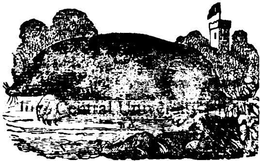
1. Шоаричеле дин касъ (Mus Musculus).

Шоаричеле (Mus) este знă animală микă, foarte ңentілă ши foarte poditoră (Aristotel zиче кз а възстă кз dинт'о переке де шоаречі, а ешитă în кърсаă де 7 лăні, 150 нăі); sінтă foarte sfіичіоші; аă о кодіцъ сьзцуре пъроасъ ши парк аконепите кз солцърі ши d'о foormъ партікларъ (коада шоричелăші, е vestітe pentрă forma sa); канялă лорă este askьцитă; аз нмаі 4 оінді тьіоші ши ките тpeі мъселе Іn дреанта ши стінга dar кз ачеші пьціні dингі мънінкă маі мълтă де китă поі кз 32 че'і аветă Сь гъсескă пе кінпърі, Іn пьдърі ши Іn каселе оаменилорă; пьтемă сь зичемă кз доменялă шоаречилорă este лъмеа Іntреарг. Sінтă омпивоаре адекъ мънінкъ тоале лъкръріле че гъсескă: пліне, фьпъ, хайнеле, тоале вецеталеле, тоале кърнзріе ши кeарă талпъ де чизме; дарă се ши мънінкă знă пе алтă.