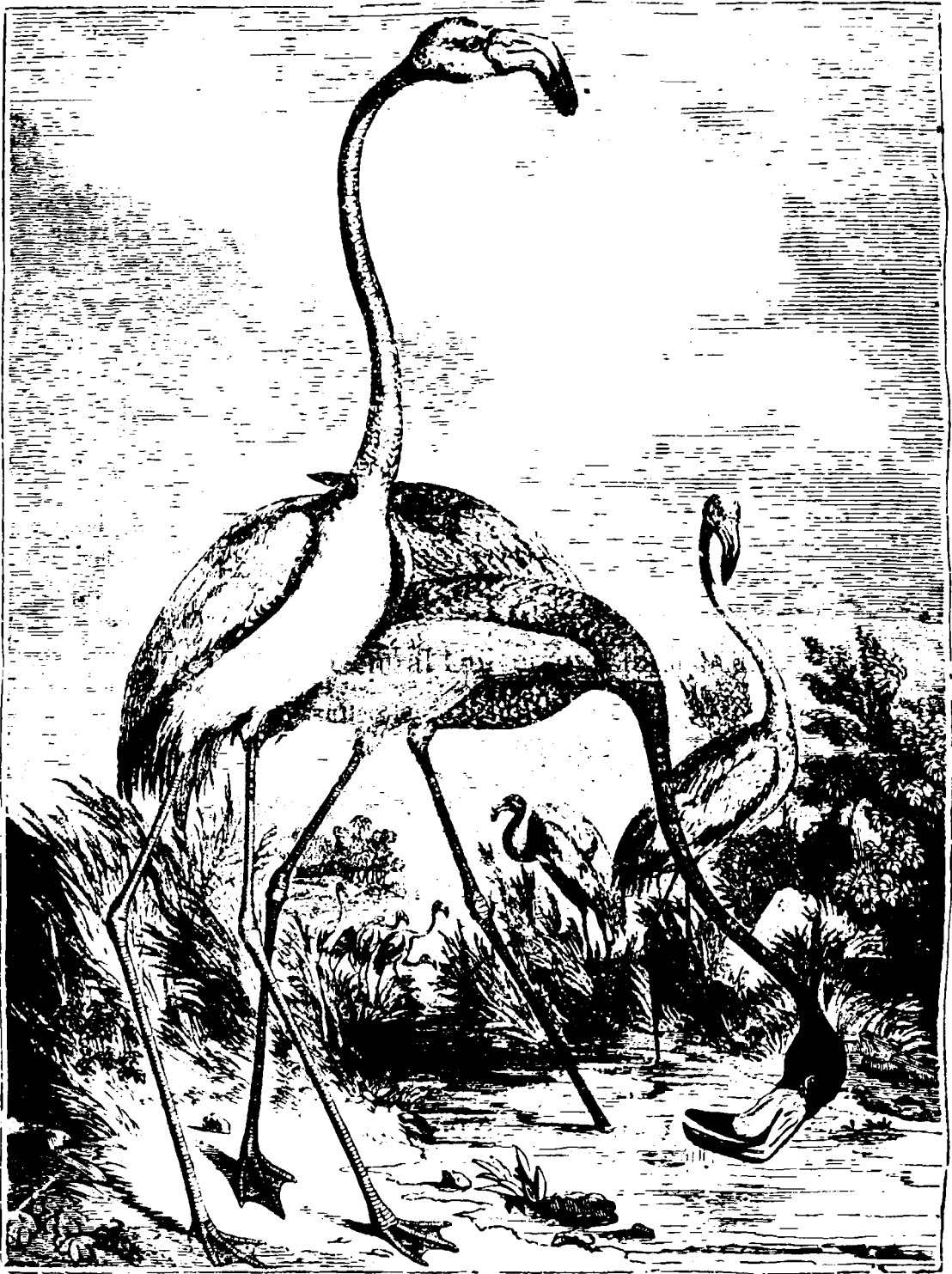
Пасăреа Flamingo (Phoenicopterus Roseus) la puii săi.

Această pasăre poate prea bine în apă, întotdeauna ca rața și găște și când zboară, ac- kzai între degetele lor și o peliță întinsă înălți observă obiceiurile și obiceiurile; adesea când