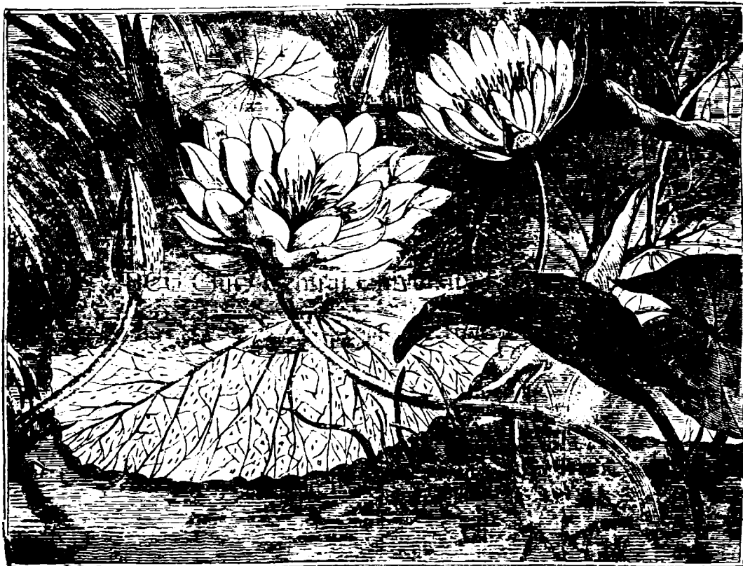
Planta Lotos din Egiptă.

Pentru toate nămitelē kvalitățilē, planta Lotos era foarte venerată la antičii Egipteni. La temple, mai că seamă la coloanelē care ornaă ačeste temple, să găseskă sâpate foile frumoase a ačestei plante. Istemă kear să zicemă că ačeastă plantă a fostă celă d'înțilă obiectă, care a fostă prezentată prin arta skulpturēi. Eară și în stilălă arhitektonikă că mai mlatē sekale maiuē șrăt, planta Lotos că trei foī ale