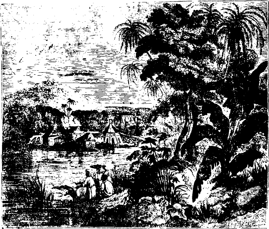
II. O plantьce de захарь in Америка.

Поньii antici n'adь kvьnoskьtь захарь про-