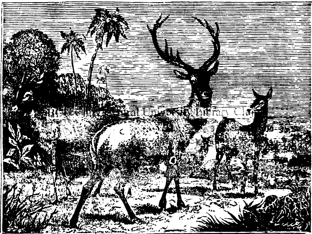
Fig. 1. Червълъ nobîţ̃.

Am̃ ṽz̃ţ̃ (în No: tpek̃ţ̃) k̃ şî la animalele poate s̃ fie vorba d'o fisiognomie care se arate ñ ñmaî prin faţ̃, çî prin toat̃ f̃ţ̃ra a korp̃ulî lor̃.