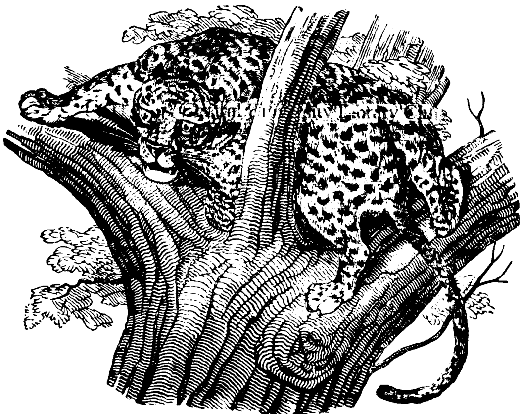
Fig. 1. (Leopardulu).

Șni și imăciș kă nămai omăș are o fisiognomie. adekă kă poate čine-va să kănoaskă prin înțușarea sa esteriore, kvalițuă saie interioare, kă fača omăș este o oglîndă ne kare se desemnează toată ființuă sa interioară. kă să zicemă așă totă portășă și șăletăș săș.