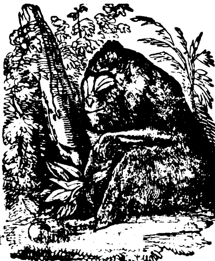
6. ( Maimon )