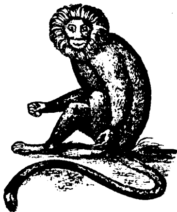
5. ( Harpale Rosalia )

мїшкѣрїле ши џестѣрїле отѣлѣї ка зпѣ адевѣратѣ komediantѣ (de ачeea e ши нѣмеле eї de komediantѣ). Трѣеште în Brasilia ши Guiana. Sїntѣ animale d'o fire блїндѣ ши аѣ зрме de іntelїценџѣ; s. e. кїндѣ ворѣ сѣ треакѣ зпѣ рїѣ, formeазѣ ка зпѣ лапѣ зна џїндѣ-се не алта ши аша факѣ зпѣ фелѣ de подѣ peste каре трекѣ камаразїї лорѣ (аша рапортѣ Ulloa ).