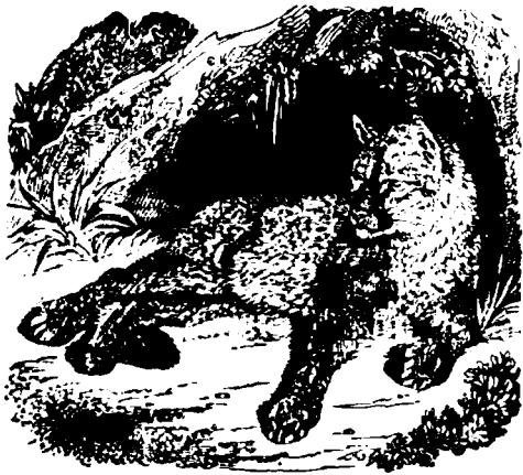
Cїguarulũ sađ Leulũ american

Eлъ s'арeнкъ шї атакъ кїпeлe, oмoаръ шї прeпъдeштe мeлтe ої шї este кїар пeрї-кeлoсъ пeнтрe oмъ; нe se тeмe нїчї де фокъ (ка лeнe) шї кїндe ва чїнe-ва сeл oмoарe