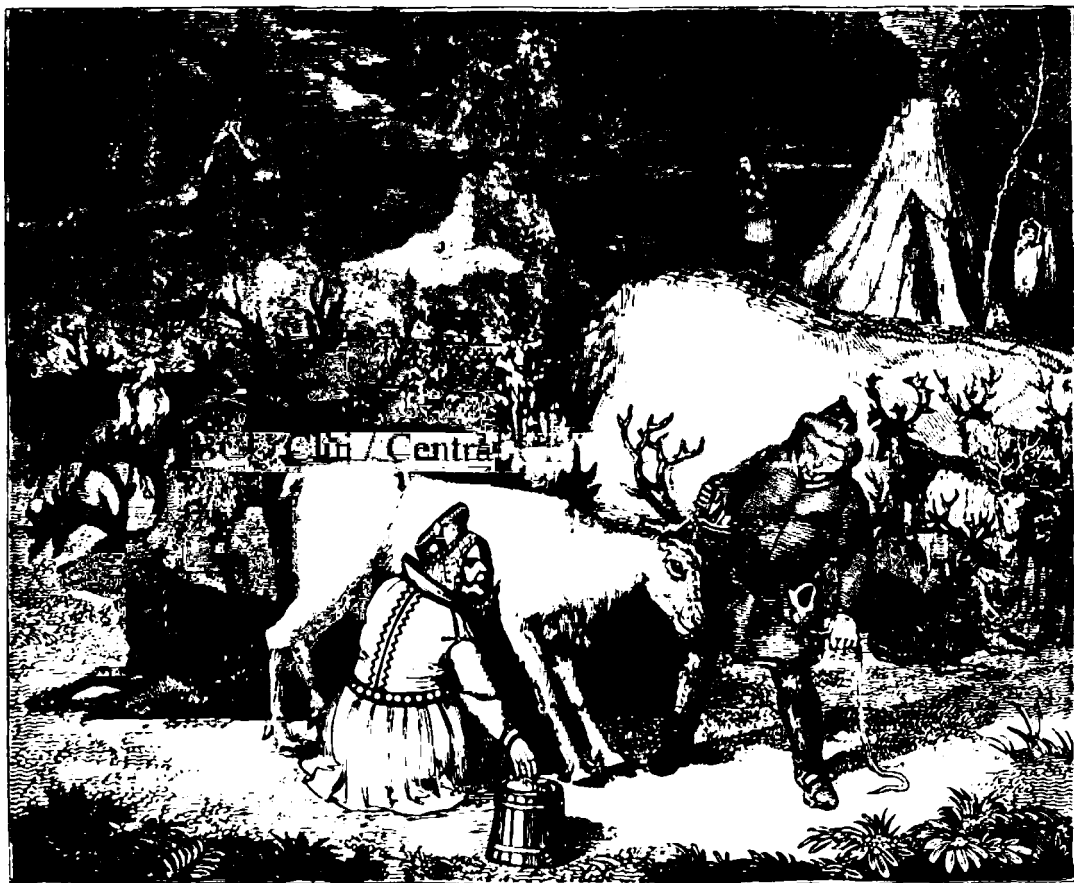
Червълъ ренъ (cervus tarandus) ін Лапонїа.

Червълъ ренъ окъпъ ін исторїа натъралъ о позиціоне интермедїаръ інтре червълъ по-