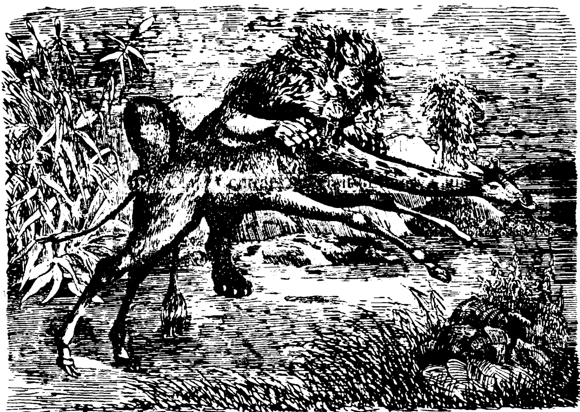
II. Girafa atakată de lei în deșerte

este aceea ce se arată, și nu se arată aceea ce este, căci este din toate și nimic impres- nă. Așa dar ce este Girafa? Natrălistii anti- tiți az zisă că e minșne a natrăi, de aceea kîndă Cesară a sșnsă Afrika (46 în. de Xrist.) a adășă la Roma pentră trîmșăță și o Gi- raffă, par' că ară fi vrăță să arate că acesă că șna din miracalele viteziēi sale este că a