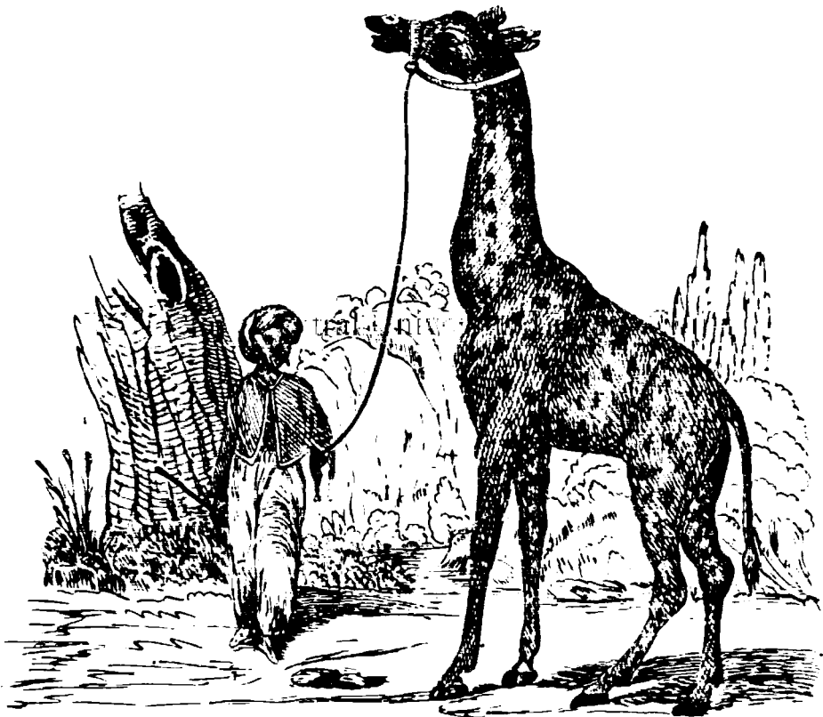
I. Camelopardalis Giraffa L. — Цирафа.

mӓlte varietӓцӓi adӓnate fr̄ь планӓ ӓi armonie) ear nӓ poate fi fr̄mosӓ. S. e. o kӓmpie de nisӓnӓ este ӓnӓ ӓkrsӓ monotонӓ, dar nӓ fr̄mosӓ; asemenea ӓi ӓnӓ kӓmpӓ sӓlvatikӓ kӓ felӓrimӓi de plante diverse semӓnate fr̄ь планӓ, earӓ nӓ e fr̄mosӓ, ne kӓndӓ o грӓdinӓ kӓ florӓi, in kӓre florile sӓntӓ aranжiate kӓ планӓ ӓi sistemӓ, ne плаче. Kӓчӓ aчӓi se aflӓ koesistӓndӓ amӓndozӓ kondiцӓionile fr̄mӓseчeӓi, adekӓ varietatea ӓi ӓ-