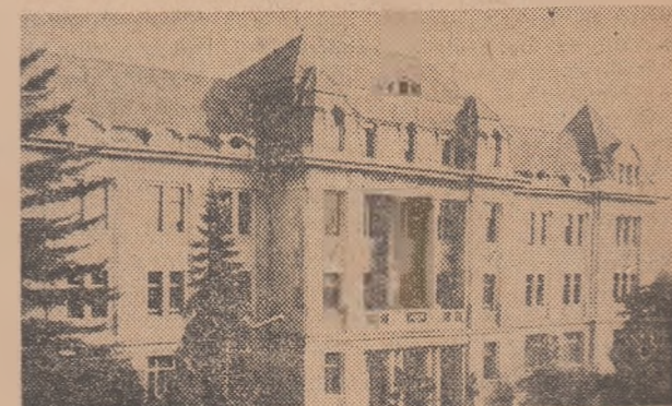
Liceul „Al. Papiu-Ilarian” din Tg. Mureș