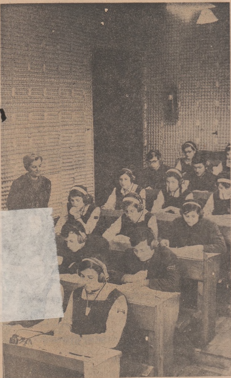
Intr-unul din laboratoarele fizice ale Liceului nr. 3 din Oradea

O nouă promoție de cadre didactice, pregătută în liceele pedagogice, în institute și universități și-a început activitatea la catedră. Tinerii educatori, profesorii și asistentii noștri s-au prezentat la posturi în marea lor majoritate, încă de la începutul lunii septembrie, încadrându-se în eforturile pentru pregătirea primei etape a anului școlar.