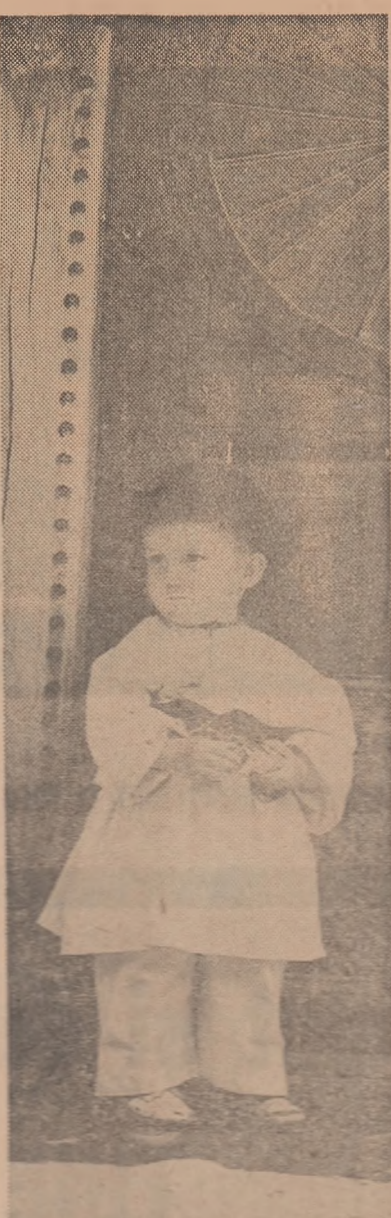
În primărie școlii

Acordarea premiilor anuale pentru studii teoretice și lucrări metodice privind activitatea pionierască.