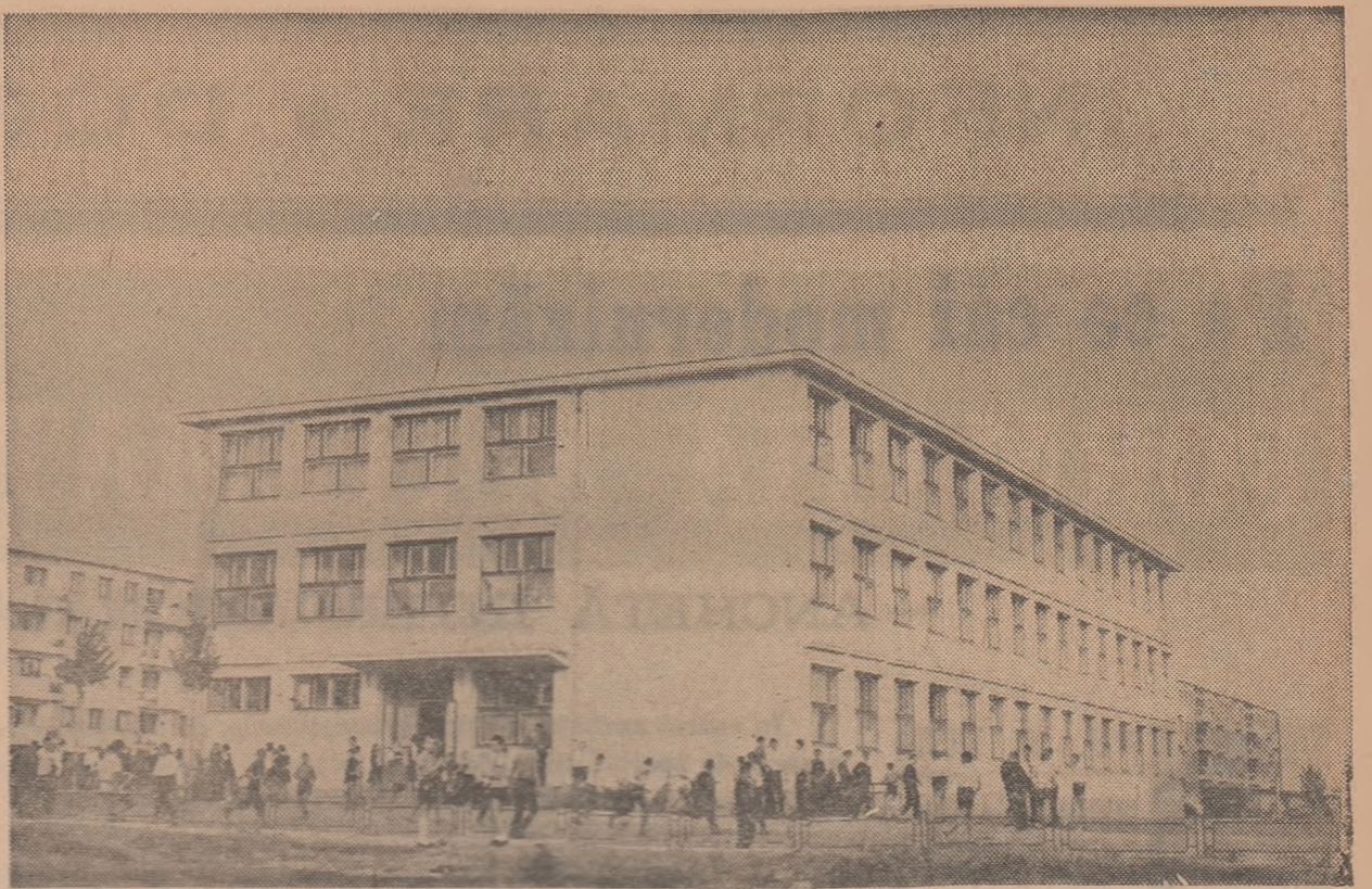
O nouă școală în cartierul Tătărași din Iași