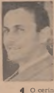
Prof. VLADIMIR MICIC, Universitatea din Belgrad

4. Cadrul didactic din învățământul superior trebuie să dețină în contact permanent cu școala de cultură generală și să fie activ implicat în realizarea activităților în cadrul procesului de învățământ și chiar a unor activități extracurriculare. În mod special este necesar ca el să-și acorde pe deplin atenția în studiul activității științifice creatoare.