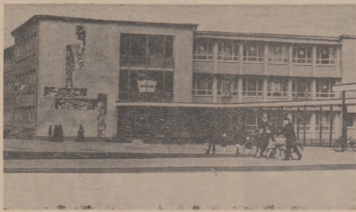
Una din noile școli din orașul Eisenhütten, centru industrial din Republica Democrată Germană