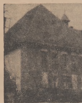
Școala generală din Cojocna

Mulți din foștii profesori și elevi prezenți la această sărbătorire au evocat momente din istoria trecutului școlii și au evidențiat condițiile bune în care se desfășoară astăzi, în școală, procesul de învățămînt. Festivitățile desfășurate cu această ocazie au prilejuit întîlnirea a mai multor generații de elevi, care au participat, împreună cu dascălii și elevii de astăzi, la programul interesant și