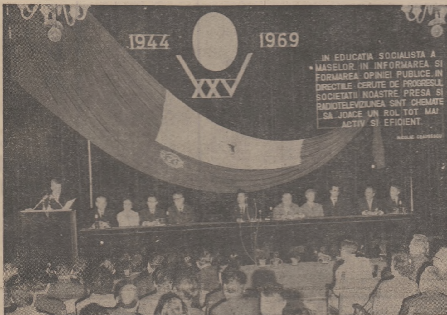
În timpul adunării festive

Cu ocazia aniversării unui pătrar de veac de la apariția primului număr legal, colectivul „Gazetei învățămîntului“ adresează ziarului „Șcinteia“ un fierbinte și tovarășesc salut, urîndu-i noi succese în îndeplinirea nobiliei sale menirii.