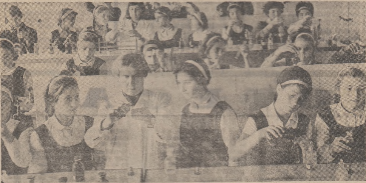
Laboratorul de chimie al Liceului pedagogic din Bîrlad oferă condiții pentru un învățămînt de calitate