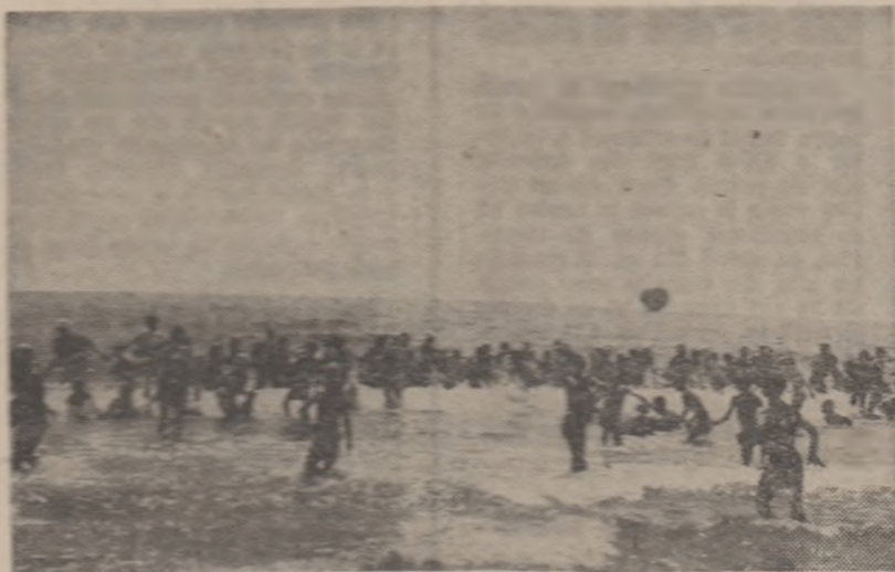
O imagine a rezultatelor unei petreceri în tabăra de la Năvodari

nirea procesului instructiv-educativ, despre sarcina acestora de a milita, împreună cu organele de învățământ, sub conducerea organelor și organizațiilor de partid, pentru aplicarea neapăsătoare a sarcinilor ce revin școlii din documentele celui de al X-lea Congres al Partidului Comunist Român.