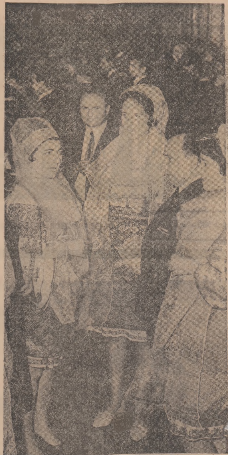
Intr-o pauză a lucrărilor Congresului