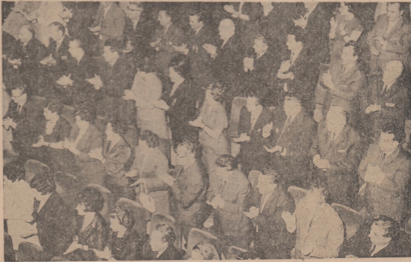
Moment din timpul unei ședințe a Congresului