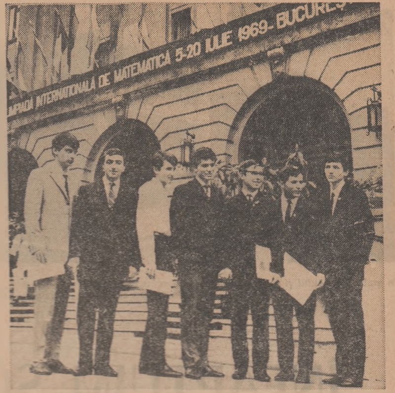
Un grup de premiați ai olimpiadei