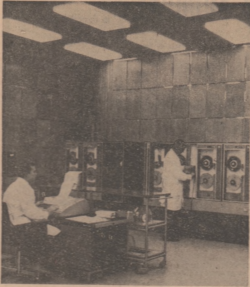
Centrul de calcul electronic al Direcției centrale de statistică — sala de calculatoare electronice

Din Belgia acad. Ștefan Bălan a plecat la Paris, unde va discuta împreună cu reprezentanții UNESCO diferite probleme privind învățămîntul.