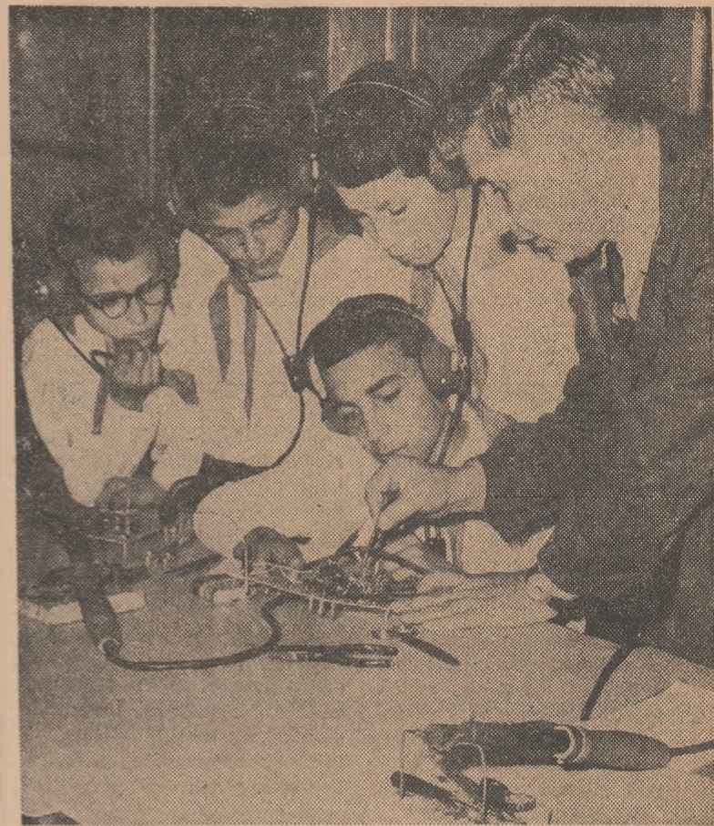
Multiple și pasionante sînt activitățile pe care le pot desfășura pionierii în cercuri, la casele și palatele pionierilor. Fii ai unei epoci de mari cuceriri tehnico-științifice, cei mai mulți purtători ai cravatei roșii optează pentru activitățile în care sînt prezente pe prim plan știința aplicată și tehnica. Iată un moment ilustrativ la Casa pionierilor din Iași.

■ Preocupări de orientare școlară și profesională pe plan mondial — pag. 3 ■ Conferința sindicală mondială asupra alfabetizării funcționale — pag. 4