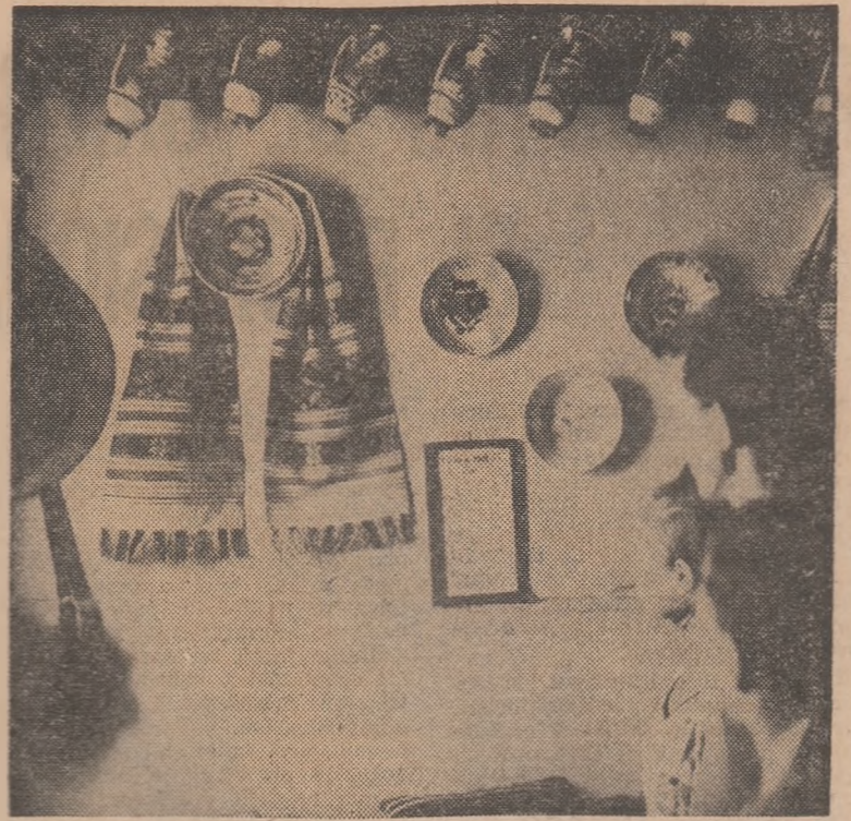
Elevi în vizită la muzeul etnografic din Lupșa-Cimpeni

Numărul 31969 al „Gazetei matematice”, seria A, cuprinde articolele „Introducere în logica propozițiilor (Conjuncția)” de Gr. C. Meșil, „Probleme de similitudine în sumele simetrice și în ele de matrici” de H. Jaga, „Noțiuni de teorie grafică” de J.M. Stancu-Minacian, „Teoria unitară acionomă” de I. Teodorescu, „Asupra construcției inelului polinoamelor” de N. Teodorescu. Se publică, de asemenea, probleme propuse și rezolvate.