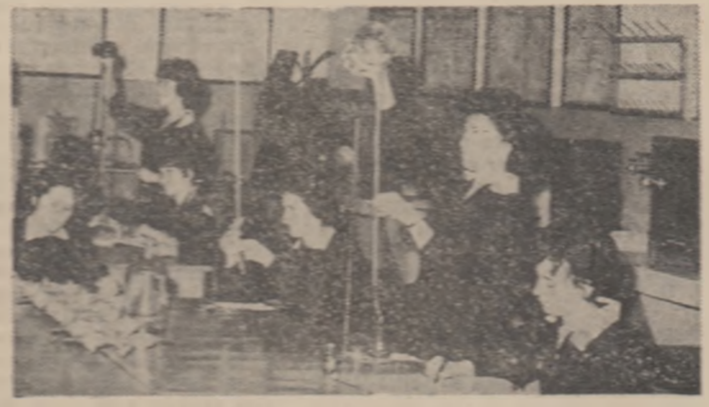
Lucrări practice în laboratorul Liceului Industrial pentru industria alimentară din Capitală

BRĂILA, în cadrul Liceului Industrial de chimie și construcții de mașini din cartierul Hipodrom, tel. 3091, se pregătesc cadre pentru specialitatea tehnologia celulozei, hîrtiei și fibrelor artificiale.