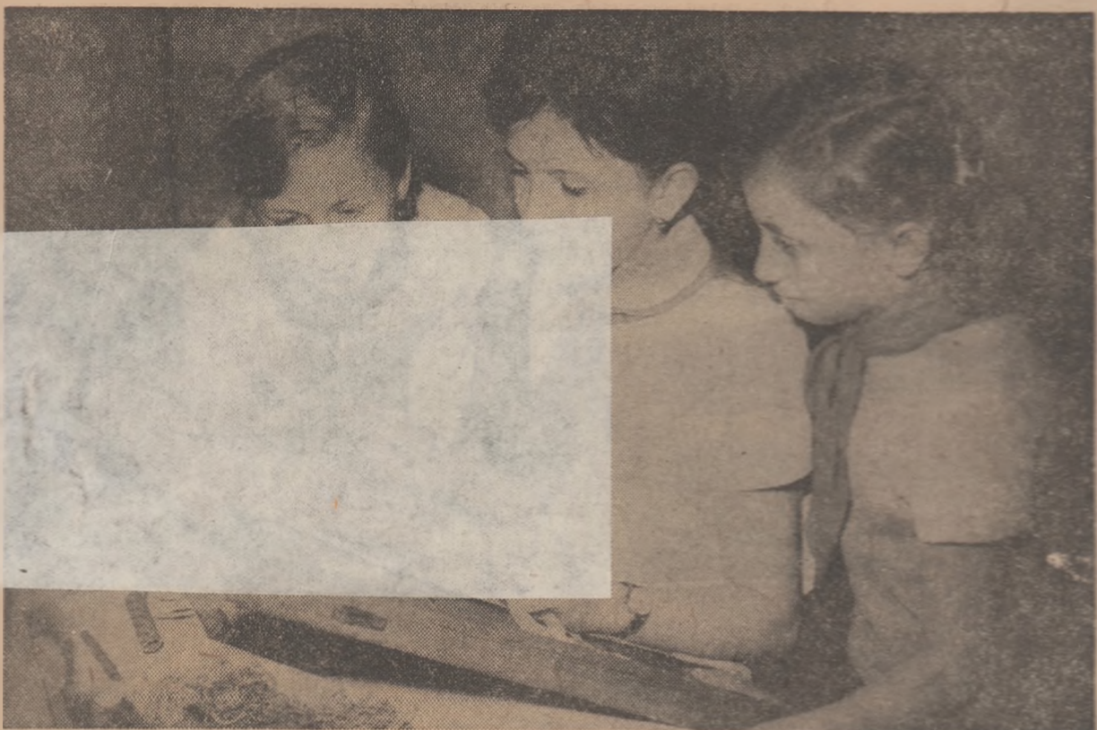
Vacanța de primăvară a adus cu sine și o activitate mai intensă la cercurile Casei pionierilor din Oradea

■ În dezbatere - proiectul planului de învățămînt pentru liceul de cultură generală (pag. 3)