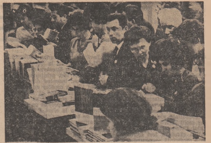
În pauză, la standul de cărţi