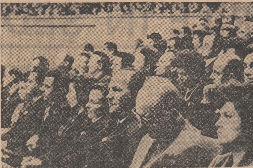
În timpul lucrărilor

În legătură cu structura şi organizarea învăţămîntului, sarcinile puse de directivele conducerii partidului au în vedere largirea accesului întregii populaţii la un învăţămînt mai înalt; diversificarea învăţămîntului; corelarea de diferite