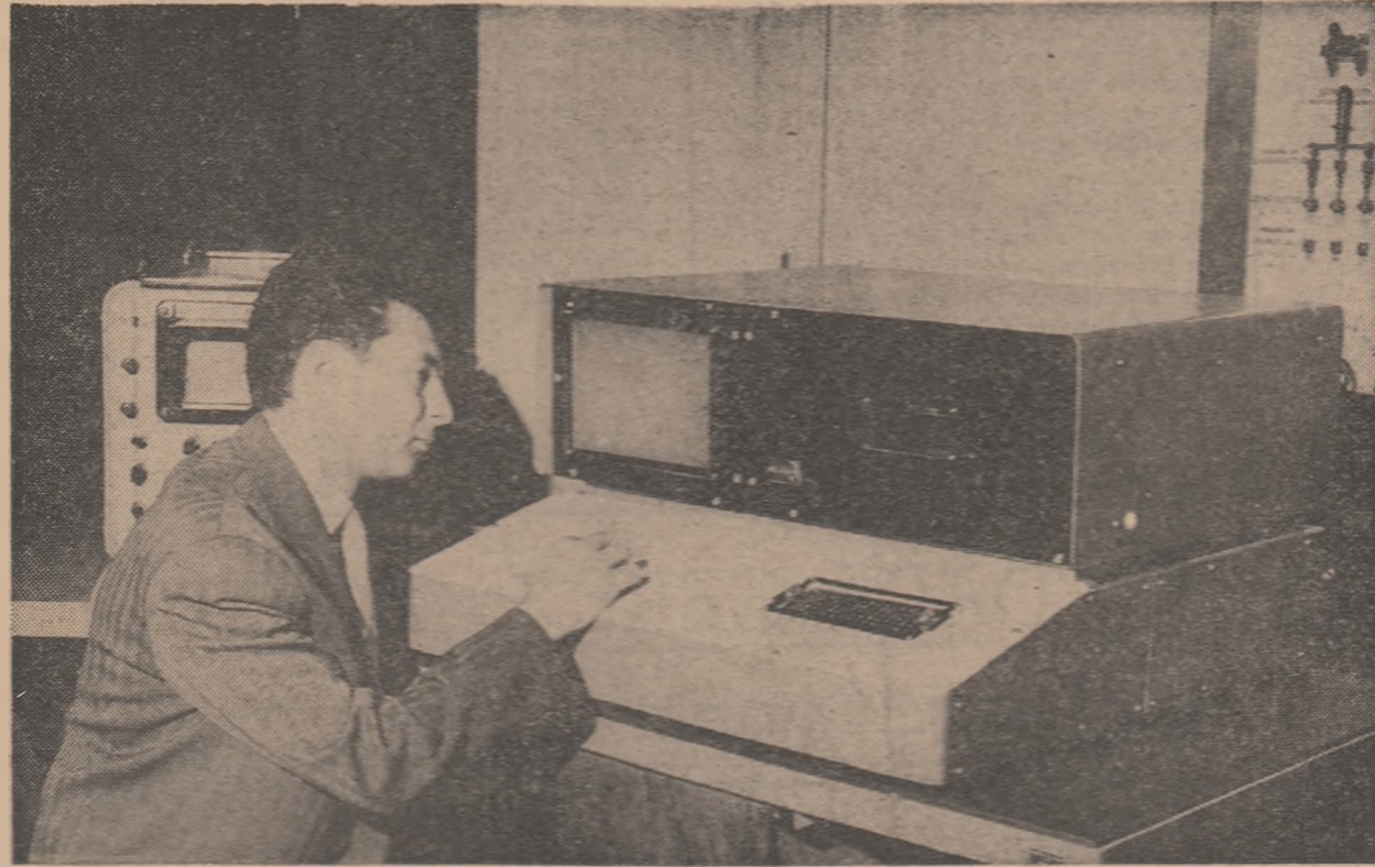
La Institutul politehnic din Timișoara a fost realizat un aparat pentru verificarea după program a însușirii cunoștințelor. Aparatul a fost realizat de un colectiv al Facultății de electrotehnică

Alături de ceilalți oameni ai muncii, slujitorii școlii, participînd activ la toate manifestările din cadru campaniei electorale, își exprimă sprijinul neclintit față de însușitorii țării înscrise pe steagul partidului, își afirmă hotărîrea de a marca această perioadă premergătoare alegerilor prin noi și prețioase succese în muncă, în marea operă de edificare a României socialiste.