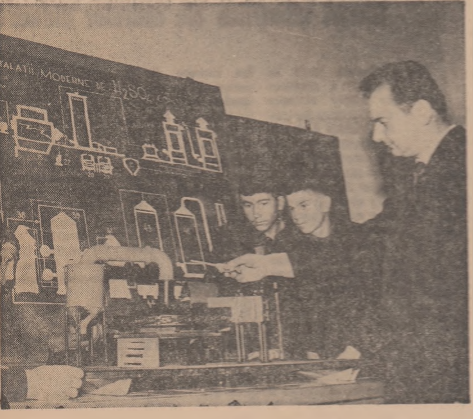
O lecție practică la Liceul industrial muncii din Bacău Mare

Ca urmare, nivelul lecțiilor de specialitate