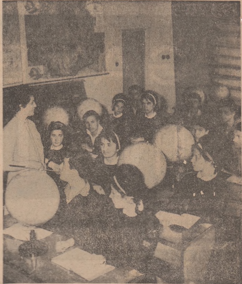
In cabinetul de geografie al Liceului „Dimitrie Bolintineanu” din Capitală