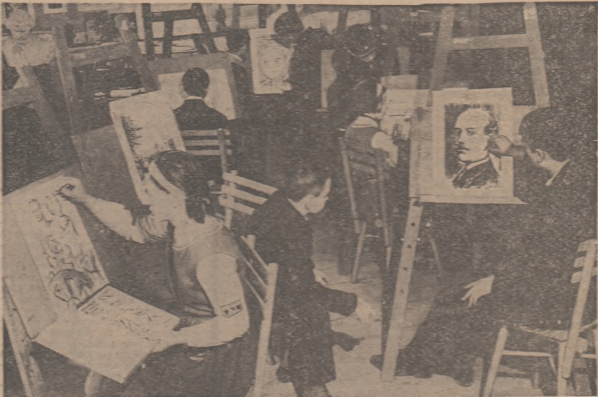
Le cercul de artă plastică de la Casa pionierilor din Botoșani.