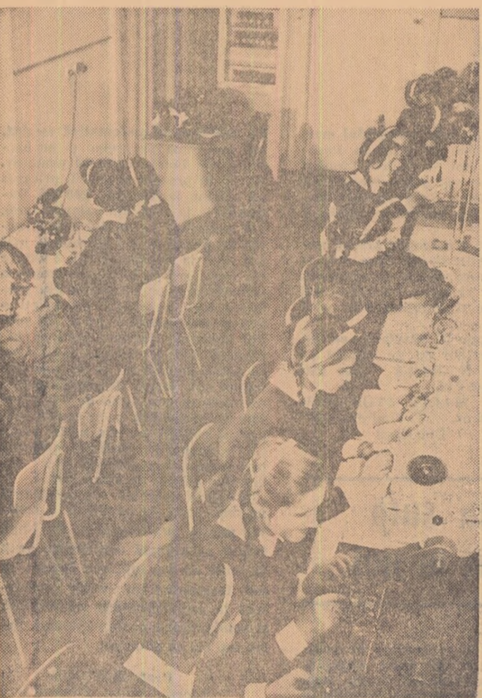
În laboratorul de analize textile a Centrului școlar profesional și tehnic, Timișoara.