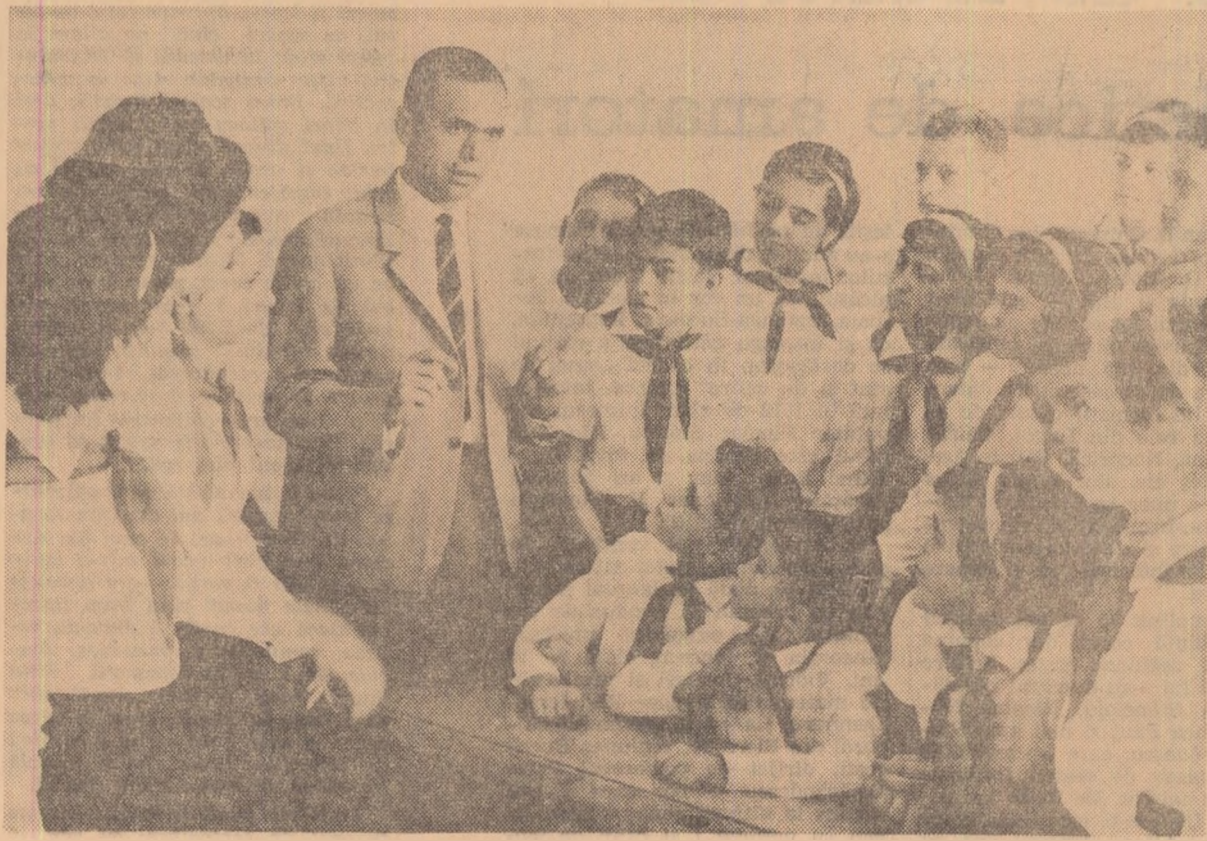
Pionieri ai Școlii nr. 150 din Capitală se sfătuiesc cu comandantul lor.