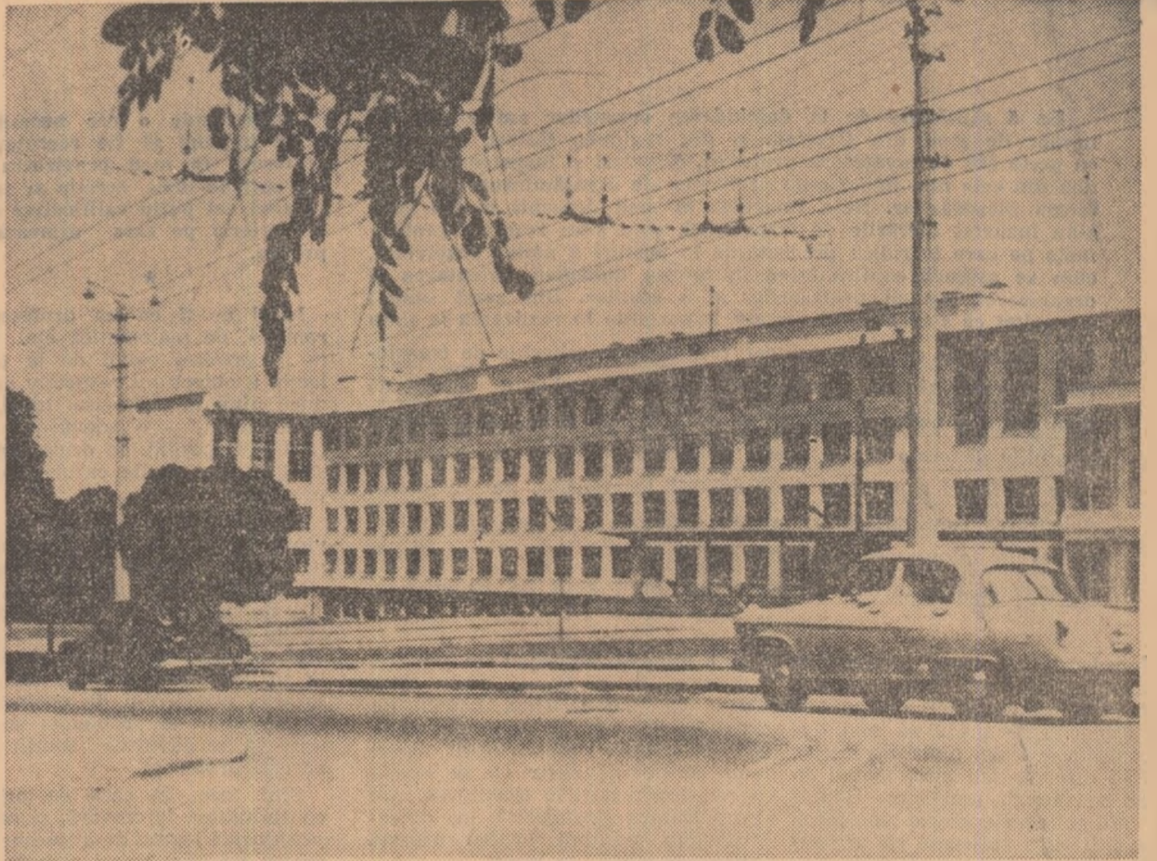
Institutul pedagogic „M. V. Frunze” din Simferopol — Uniunea Sovietică