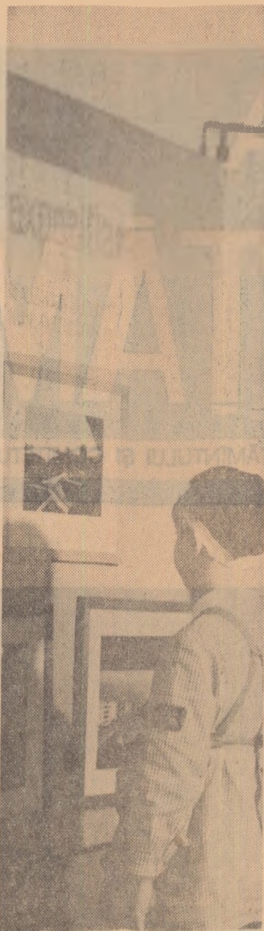
În programul educativ, vizita la muzeu este un moment important.