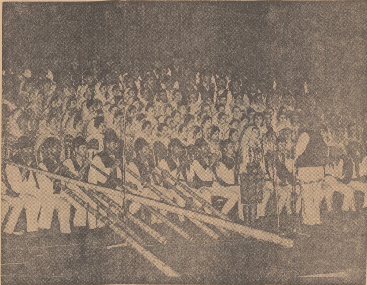
Corul Căminului cultural din Domnești, raionul Curtea de Argeș.