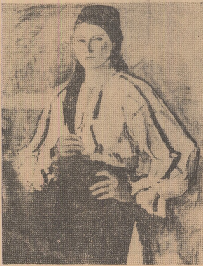
Portret de țărăncă. (Din expoziția pictorului Dinu Șerban).