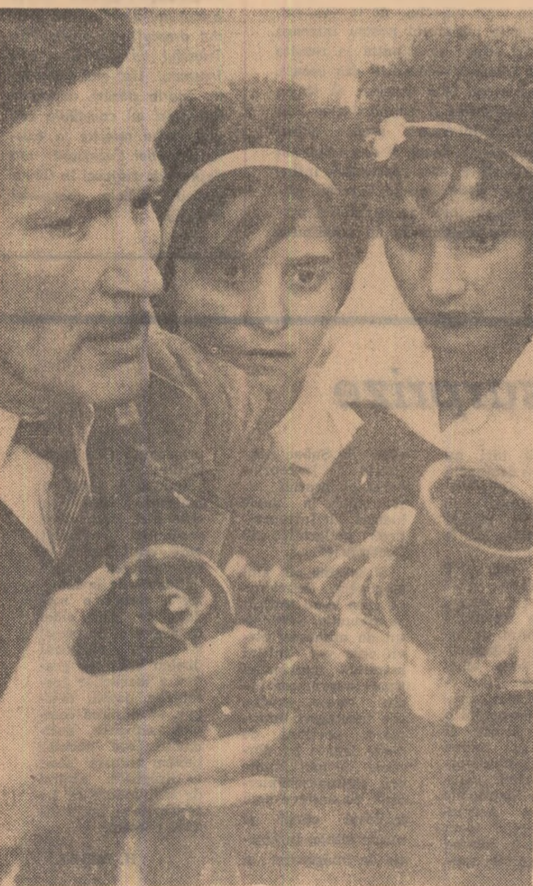
Oră de practică la Liceul industrial de construcții din Capitală.