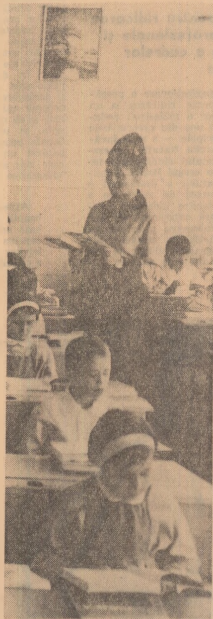
La o oră de lecturi istorice.