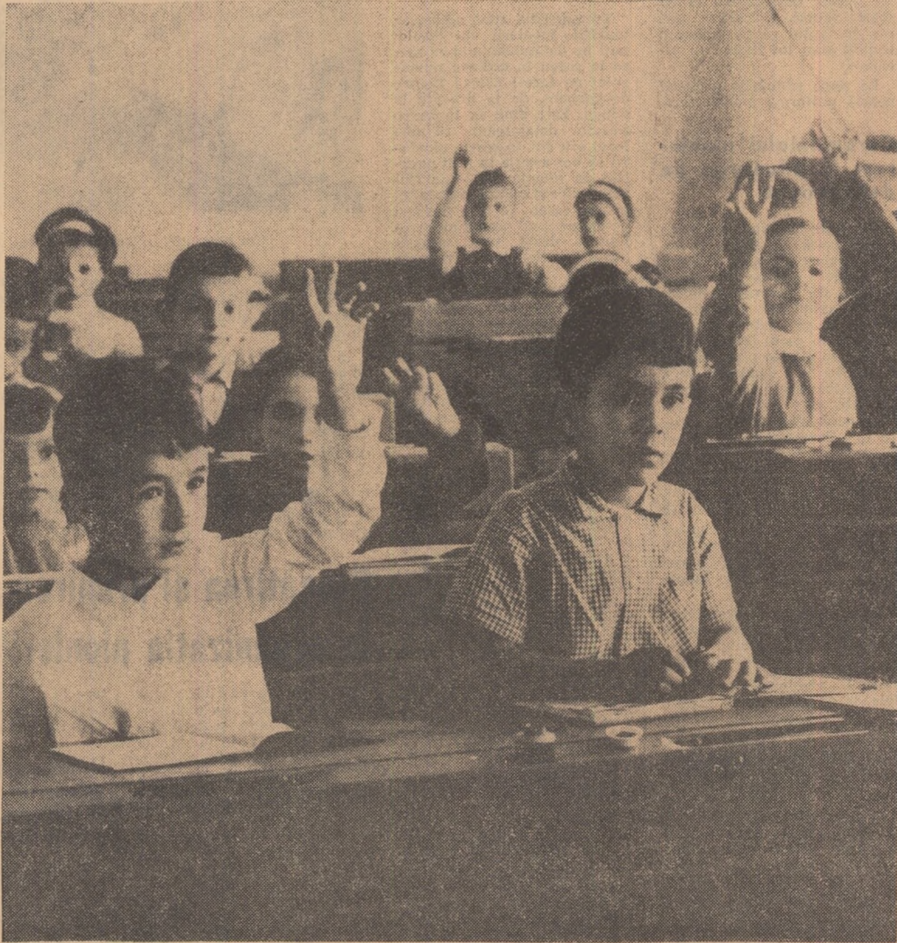
Atitudinea elevilor în timpul lecției — un punct de plecare pentru multiple observații psihologice și pedagogice.

Începutul noului an universitar constituie un moment spre care își îndreaptă gândurile cu emoție și învățătorii și profesorii. Elevii de ieri — ai căror pași i-au călăuzit cu atenție și mîngăie de la însușirea slovelor alfabetului și pînă la deplina lor maturitate — sînt studenții de azi, oamenii de mine ai societății socialiste.