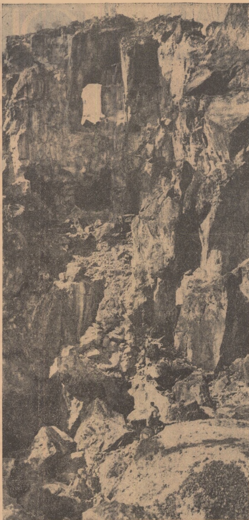
URMELE ISTORIEI — Cetate romană din Munții Apuseni.

Aspectele prezentate mai sus sînt numai câteva erpemele dintr-o bogată activitate în care s-a acumulat o valoroasă experiență. Pe baza acestei experiențe și aplicînd indicațiile concrete pe care le-au cuprins expunerile din cadrul instructajului, organizațiile sindicale își vor putea spori tot mai mult aportul la continua imbunătățire a activității instructiv-educative din școli.