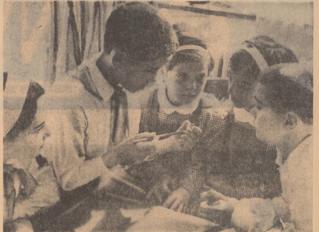
Cei mai mici școlari sînt sfătuiți de prietenii lor mai mari, pionierii.

Pionierii, schițînd la rîndul lor salutul, răspund: „Tot înainte!”