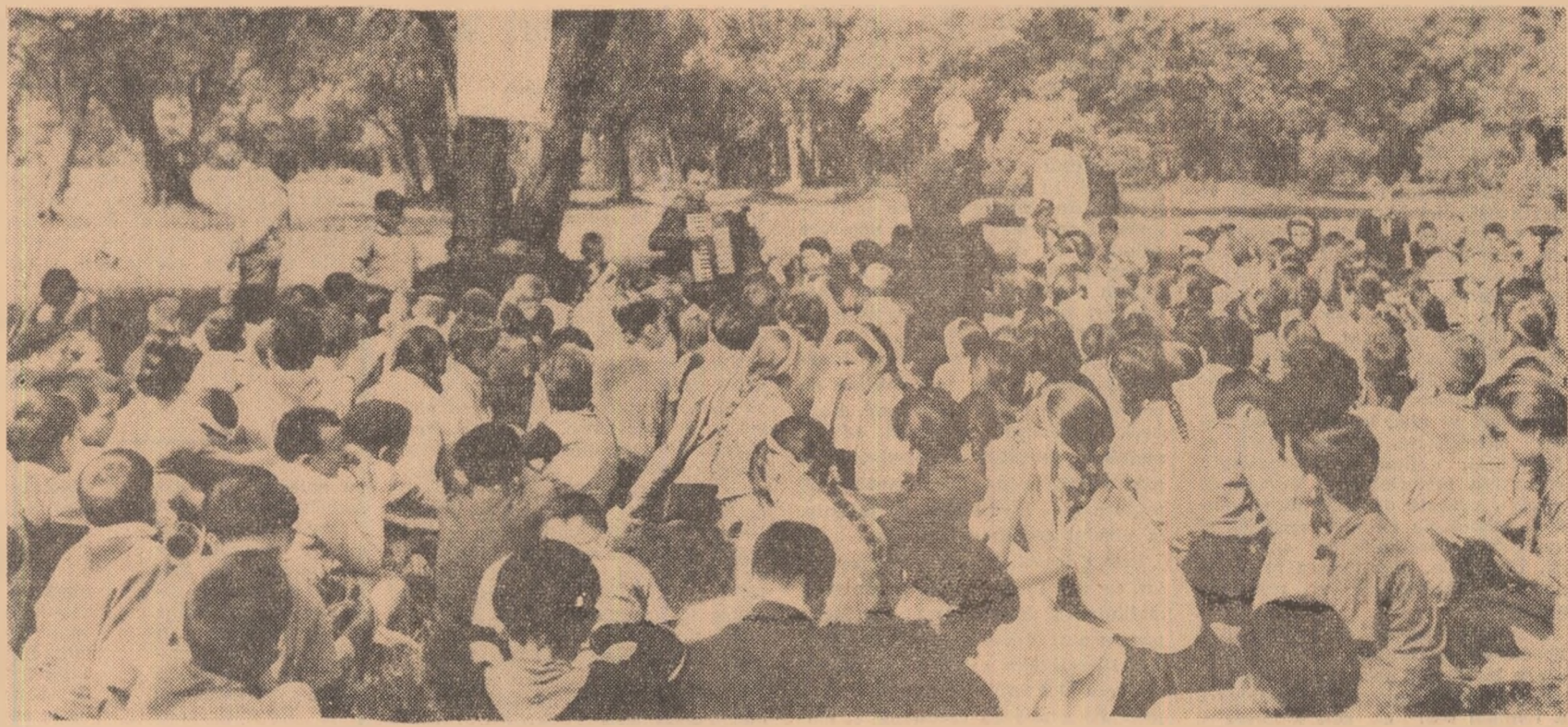
Cînt și veselte în poezia taberei de la Bucșoia, regiunea Suceava.