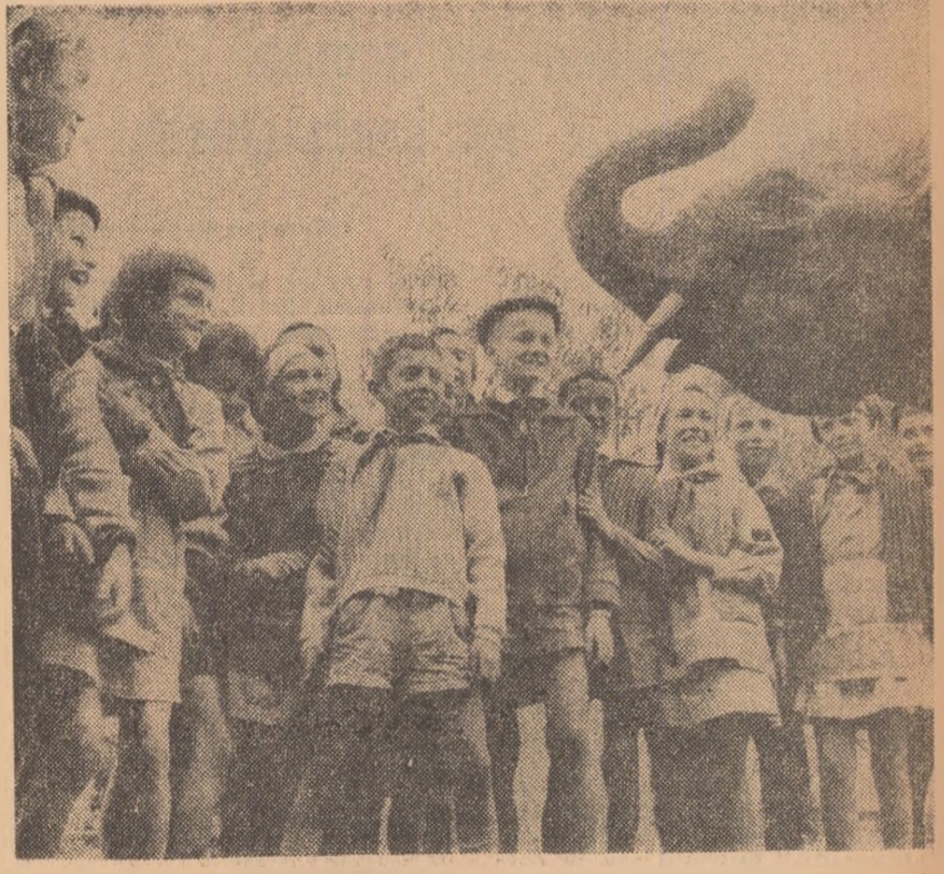
Grădina școlară de la Băneasa cunoaște o deosebită afliuență în zilele vacanței