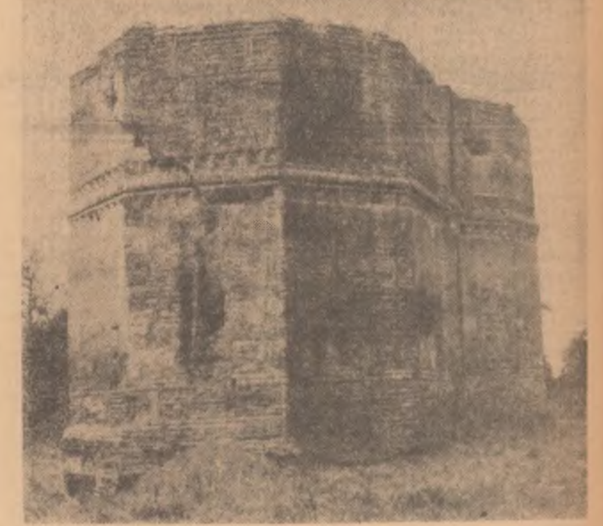
Ruinele bisericii medievale din Țirșor, înălțată în secolul al XVI-lea

— Si astfel, trecînd din epocă în epocă, ne apropiem de timpurile cele mai recente. Urmînd firul cronologic al istoriei, după reperiile descoperite aici de către profesorul care lucrează alături de arheologi, am ajuns la o așezare medievală.