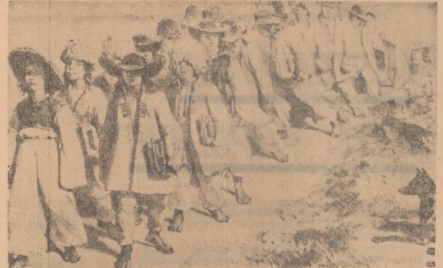
Școlari români din Orșova în ziua de 18 iulie 1837. Desenul este realizat „după natură” de Auguste Raffet și publicat într-un album de călătorie