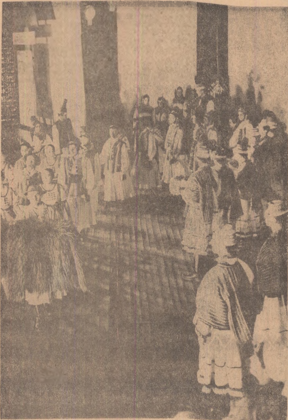
Moment din spectacolul prezentat de reprezentanții regiunii Maramureș

Un profesor și fascinația relievelor arheologice • Cărusel de milenii • Drama de la Novum Forum • Sub zidurile cetății strămoșești