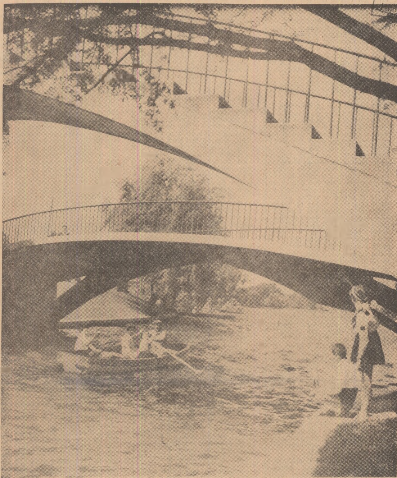
Oaza plină de liniște și de aer proaspăt, Herăstrăul, marea grădiniță a cetății lui Bucur, îi ține pe copii, acum în zilele vacanței, cu oglinda calmă și răcoasă a salbelor sale de ape, cu miracole de flori înmiresmate, cu risipa de vegetație, cu bolți înalte de lumină și frumos.