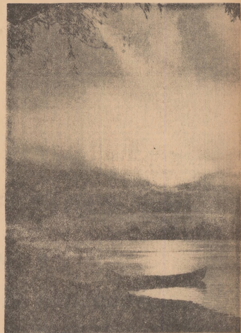
Răsăritul și apusul soarelui adaugă paletei naturale de culori a peisajului Deltei o aureolă de-a dreptul emoționantă. Iată un apus de soare.