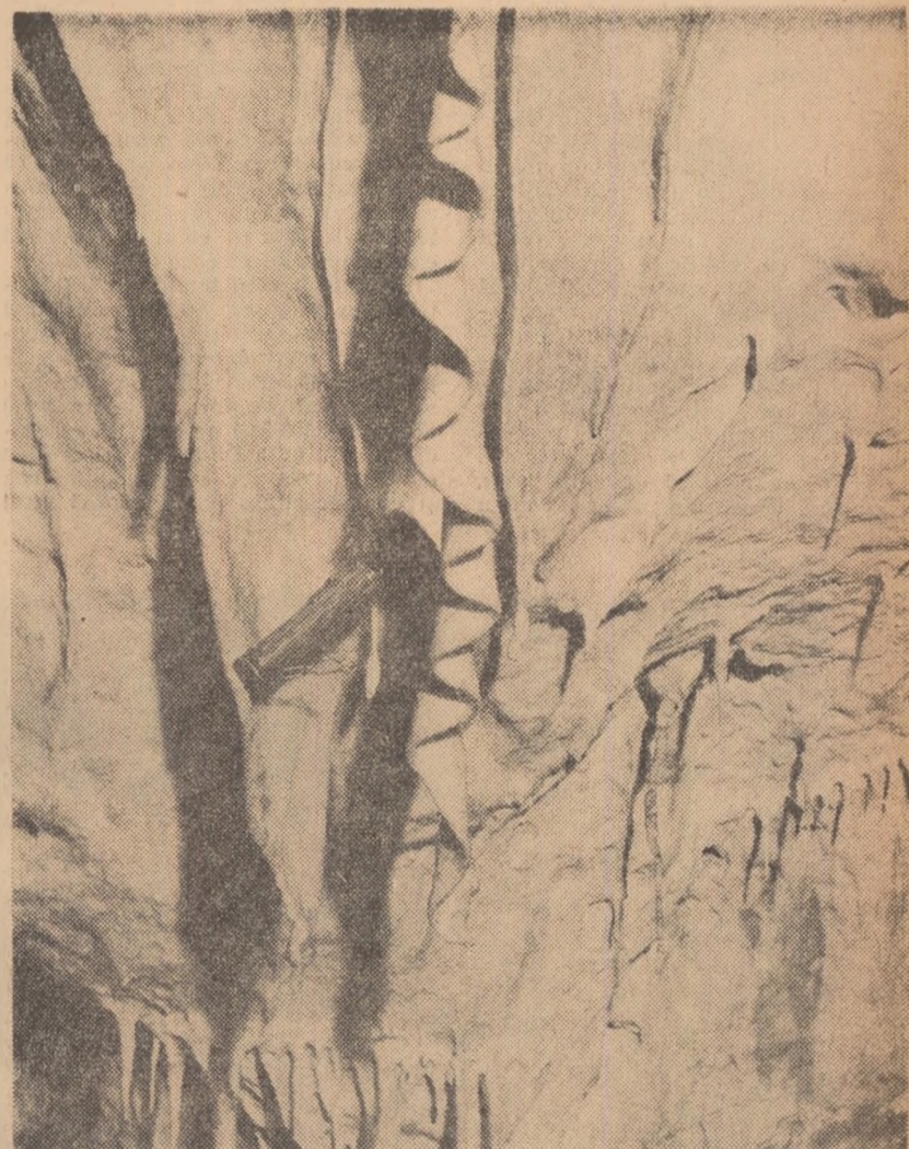
Peștera Muierii din Carpații Meridionali, situată în defileul de la Baia de Fier, desfășoară vizitatorului o feerică lume de basm. Farmecul peisajului se împletește cu interesul științific, oferind un motiv în plus pentru includerea ei în itinerarele excursiilor școlare.