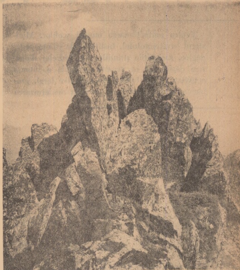
Stincile din Retezat au deseori înfățișări de legendă, multe din ele fiind legate de eposul popular. Ele produc asupra vizitatorului o puternică impresie de masivitate, dominînd de departe Valea Mureșului și coamele domoale ale Munților Apuseni. În clișeu citeva stînci de pe muntele Peleaga (Retezat).