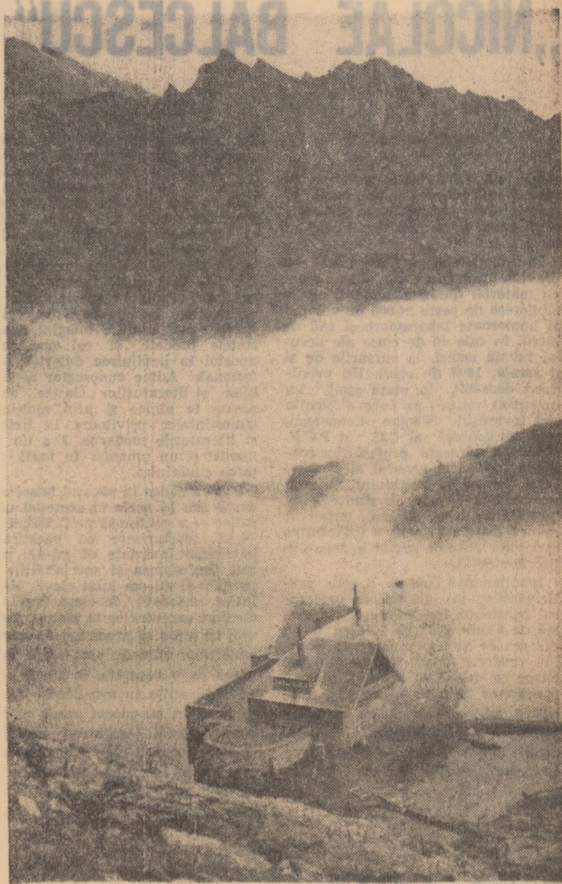
În munții Făgăraș se găsește peste 70 de lacuri de origine glaciară. Cel mai mare dintre ele este lacul Bilea, aflat în bazinul Cîrșoarei, pe versantul nordic al masivului, la altitudinea de 2034 m. Apa lacului oferă privilegiul unei oglinzi încremenite între stînci șemete, cu uriașe coame de piatră. Pe o limbă de stîncă ce pătrunde pînă aproape de mijlocul lacului se află cabana din imaginea alăturată, care oferă turiștilor condiții ospitaliere de cazare.

În special vara, cabana Bilea și mai ales împrejurimile constituite pentru pasionații marilor înălțimi apreciate puncte turistice.