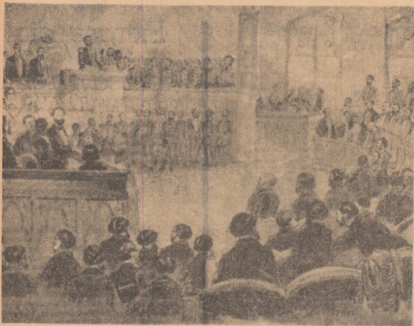
Solemnitatea deschiderii primei Camere naționale de către Al. I. Cuza