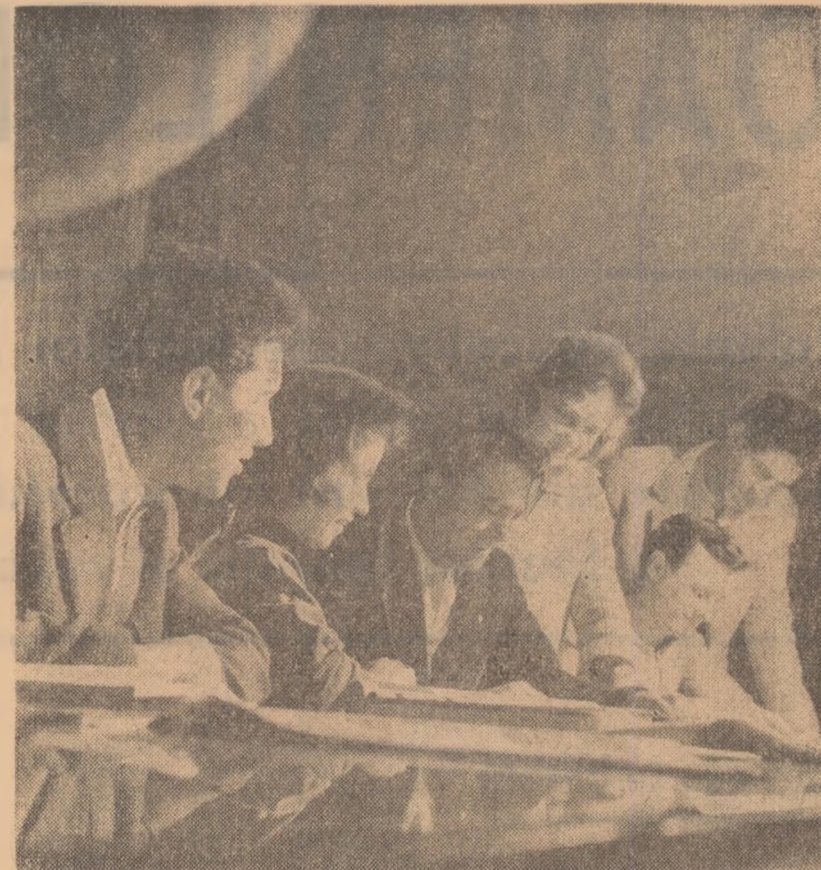
Se cercetează noulăi soșite la biblioteca