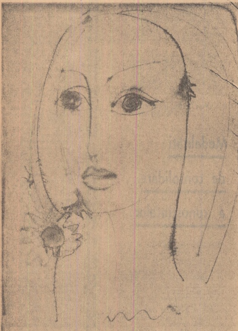
De curînd s-a deschis, în sala Dalles, cea de-a IV-a biennială republicană de artă plastică a artiștilor amatori.

autorul vorbește pe larg despre contribuția lui la eliberarea energiei nucleare. Aspectele multiple ale activității savantului sînt prezentate într-o suită de schițe scurte, care ni-l arată de la începutul cercetărilor sale, cînd avea doar vîrsta de 24