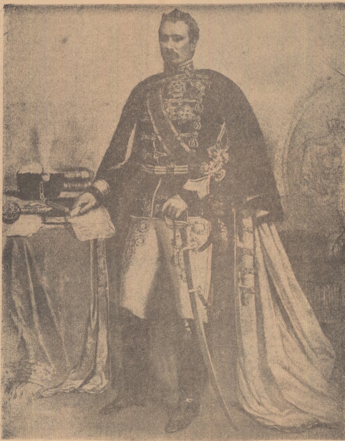
ALEXANDRU IOAN CUZA