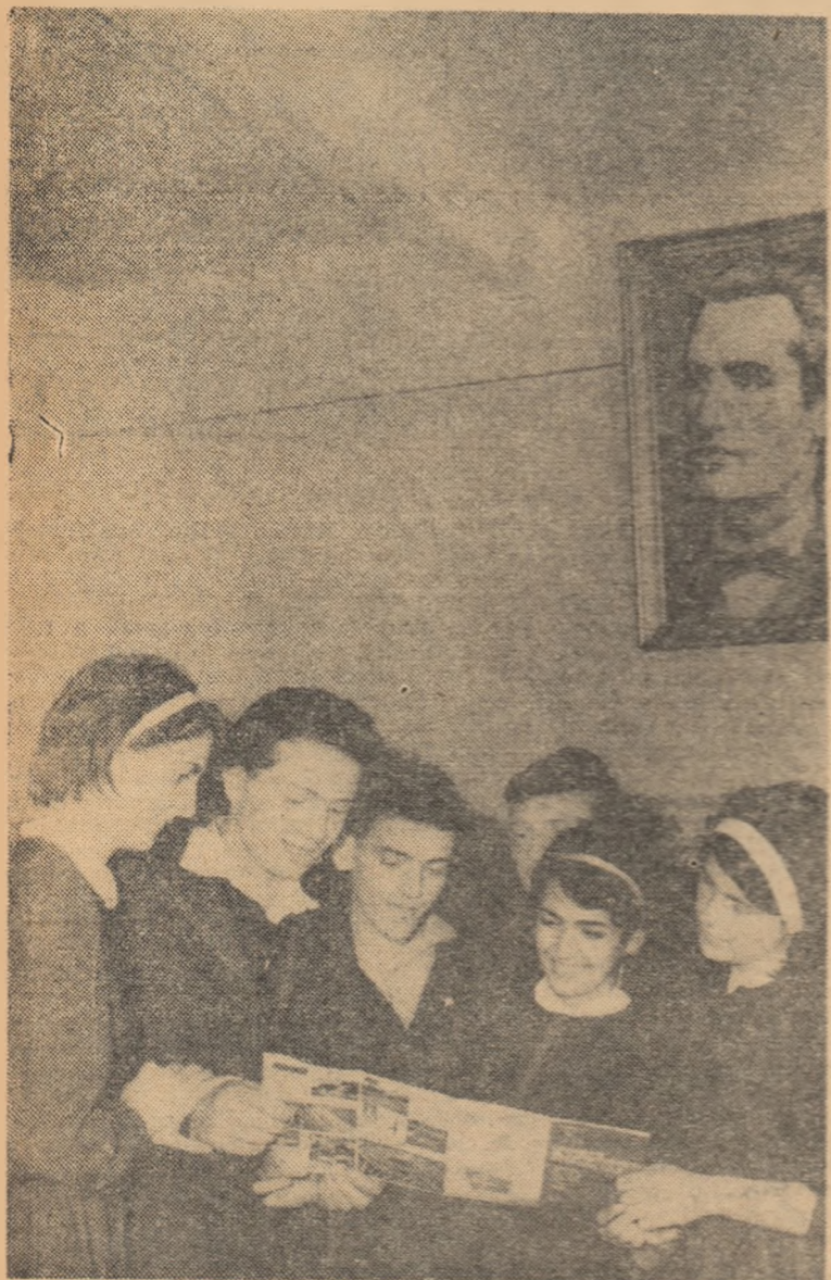
La cercul literar al elevilor de la Școala medie „M. Eminescu” din Capitală.

Imbogățirea conținutului lecțiilor cu concluzii desprinse din dezbaterile de actualitate în problemele literare intră în preocupările permanente ale profesorului de literatură, fiind în spiritul prevederilor programei școlare.