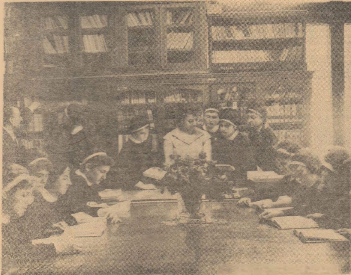
În biblioteca Școlii N. Crețulescu din București

Tot la 10 noiembrie vor avea loc concursuri de admitere la cursurile fără frecvență de la institutele pedagogice de învățători cu durata de 2 ani din următoarele localități: Cimpulung Muscel, Arad, Cluj, Galați, Iași, Sighet și Suceava