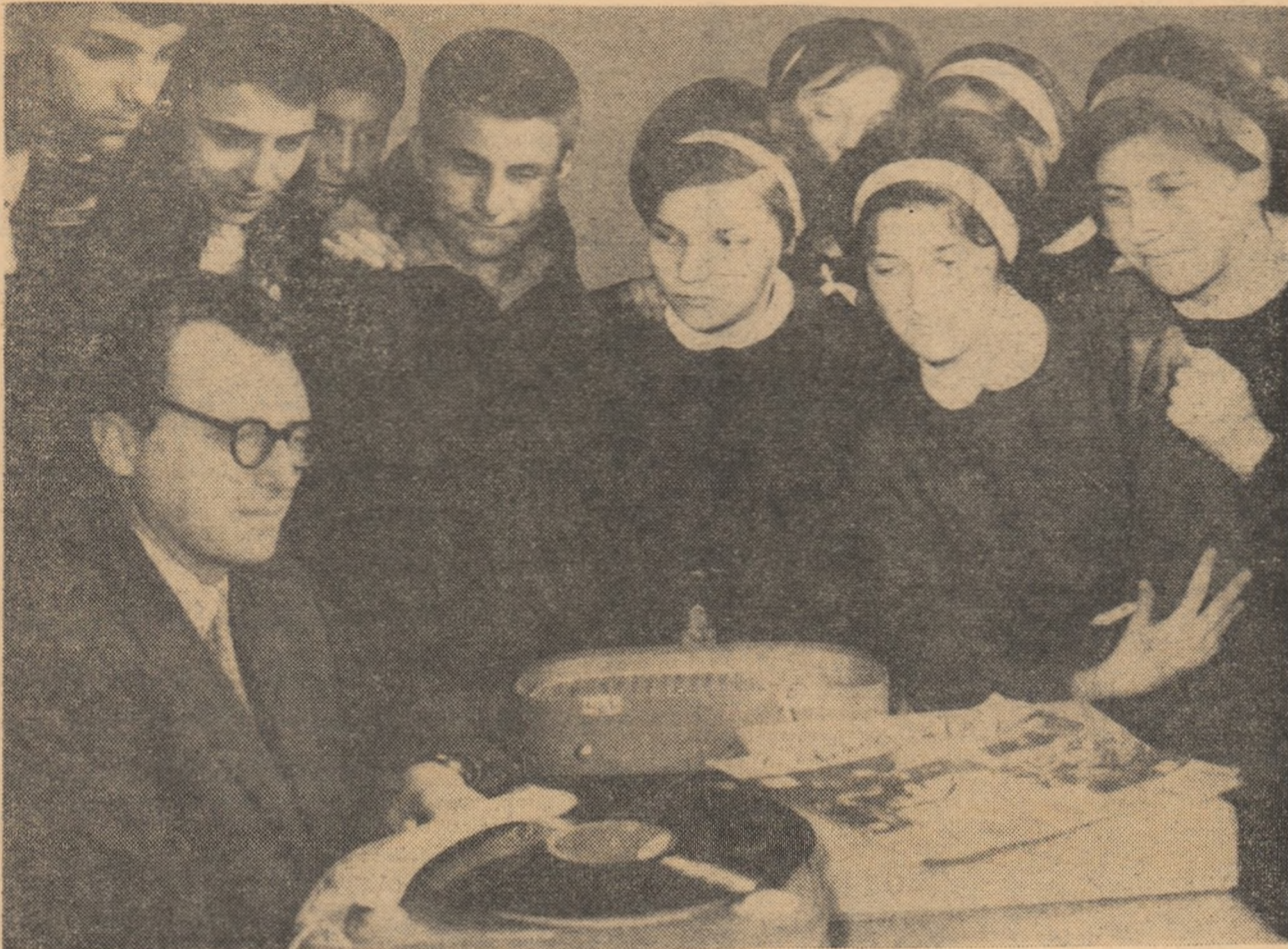
Mijloacele audio-vizuale sînt folosite tot mai larg în școlile noastre de cultură generală.