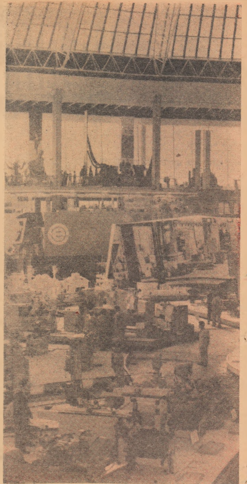
Aspect de la pavilionul central al Expoziției Realizărilor Economiei Naționale