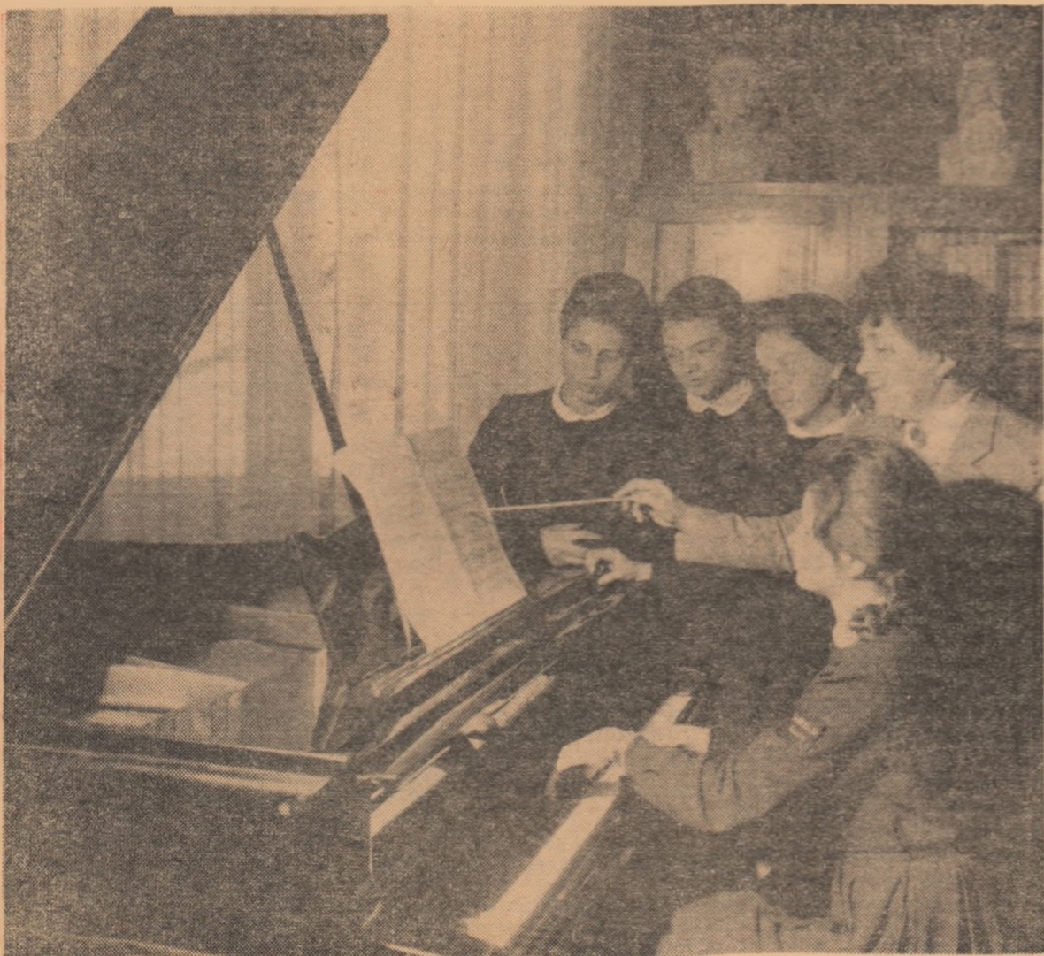
În timpul unei ore de studiu la Școala medie de muzică și artă plastică din Galați