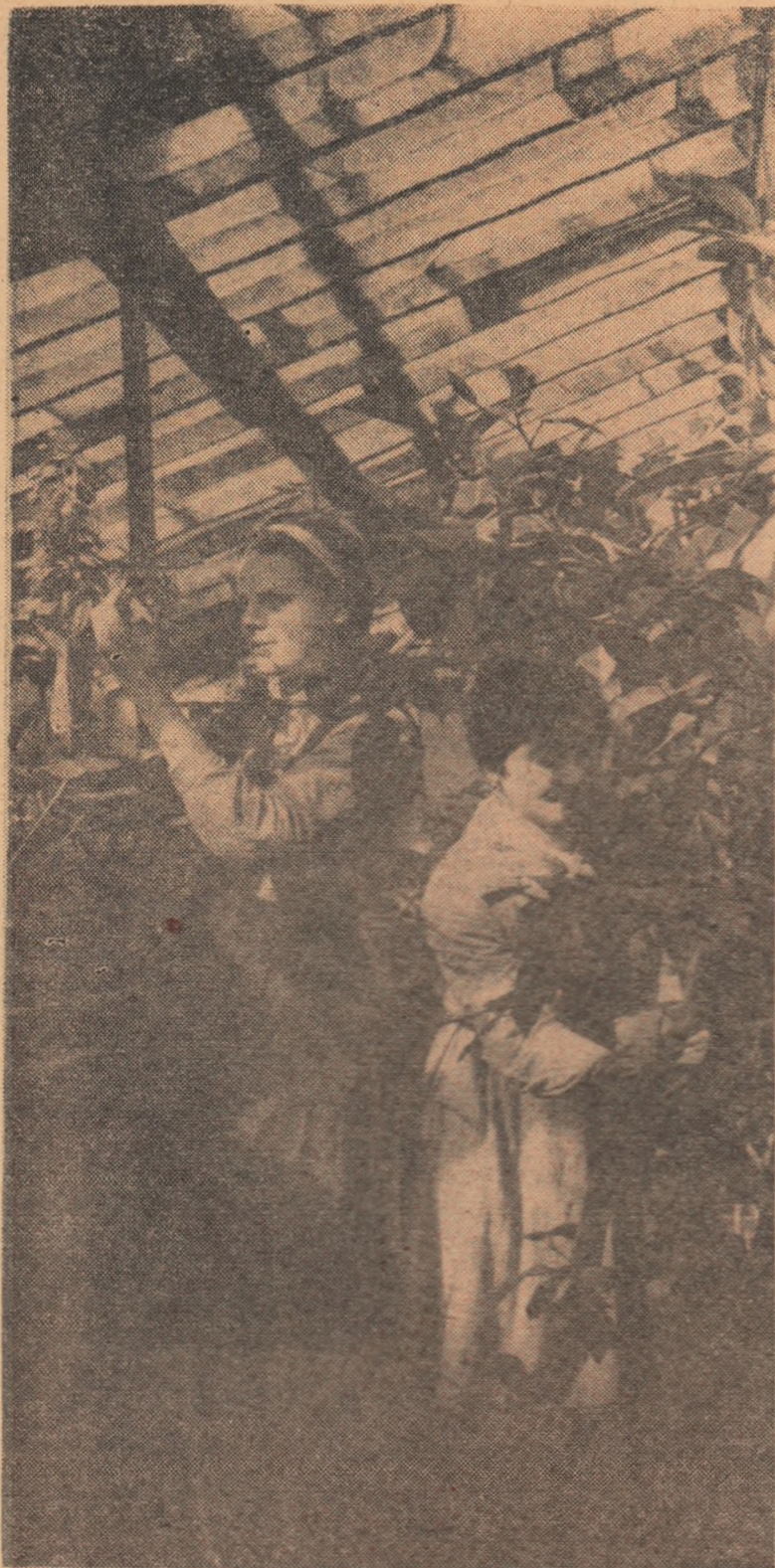
La cercul micilor naturaliști de la Casa pionierilor din Botoșani

inspector principal în Ministerul Învățămîntului