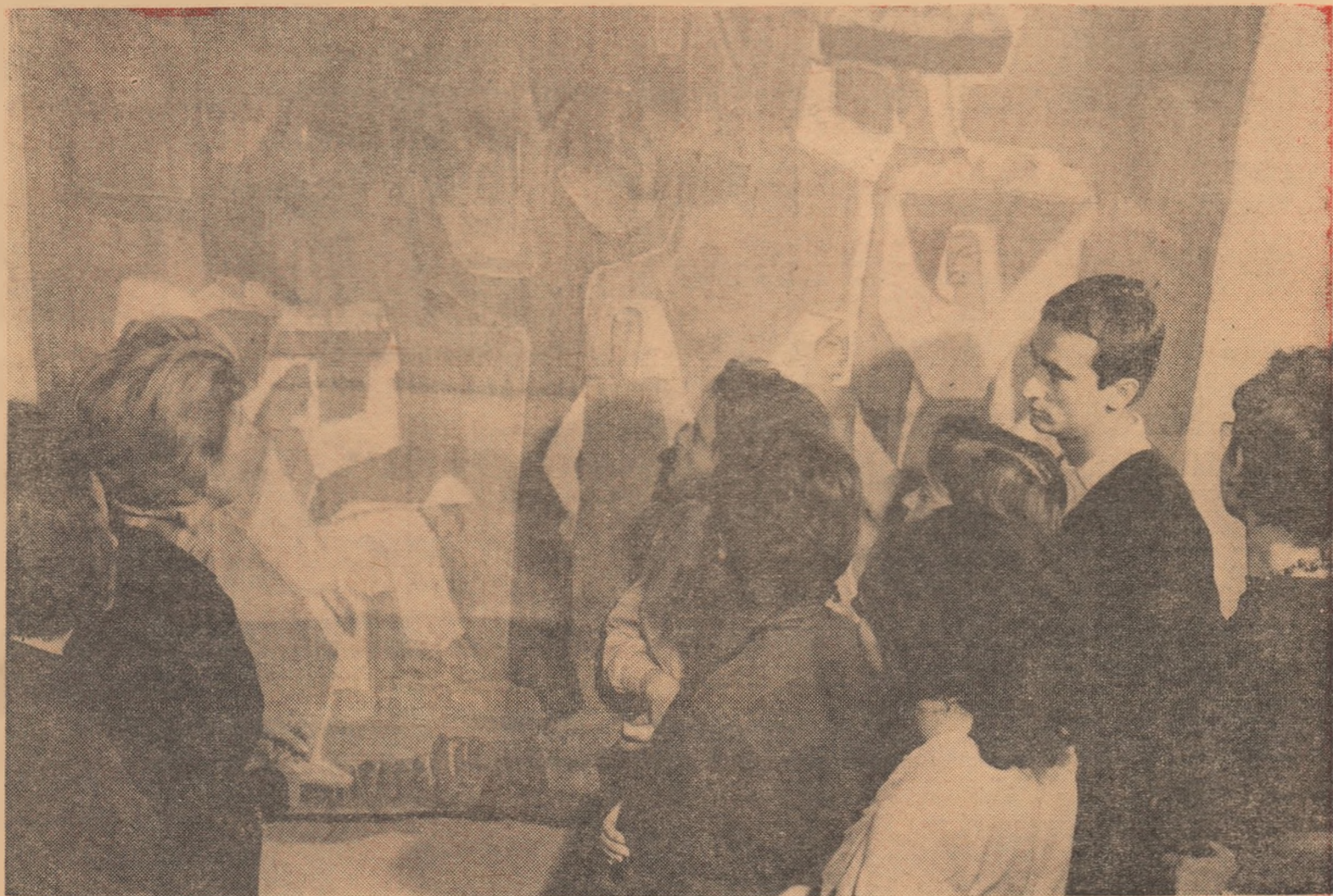
Un grup de studenți de la Institutul de arte plastice „N. Grigorescu” discutând despre lucrarea de diplomă a unui absolvent