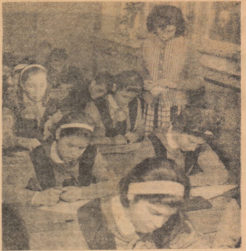
Cu fiecare lecție, tinera profesoară dobîndește tot mai multă experiență

Fapte mai puțin pozitive am înregistrat însă în raionul Mîzil, unde secția raională de învățământ nu a acționat în strînsă legătură cu organele locale în vederea rezolvării problemelor materiale legate de instalarea tinerilor absolvenți în localitățile în care au fost repartizați, ceea ce desigur a influențat felul cum aceștia s-au putut concentra de la început asupra problemelor predării. După cite am fost informați ulterior, cazurile respective sînt cunoscute de secția de învățământ a regiunii și s-au luat măsuri de remediere a situației.