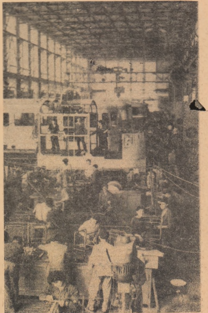
Elevi vizitînd uzinele „Electroputere” din Craiova