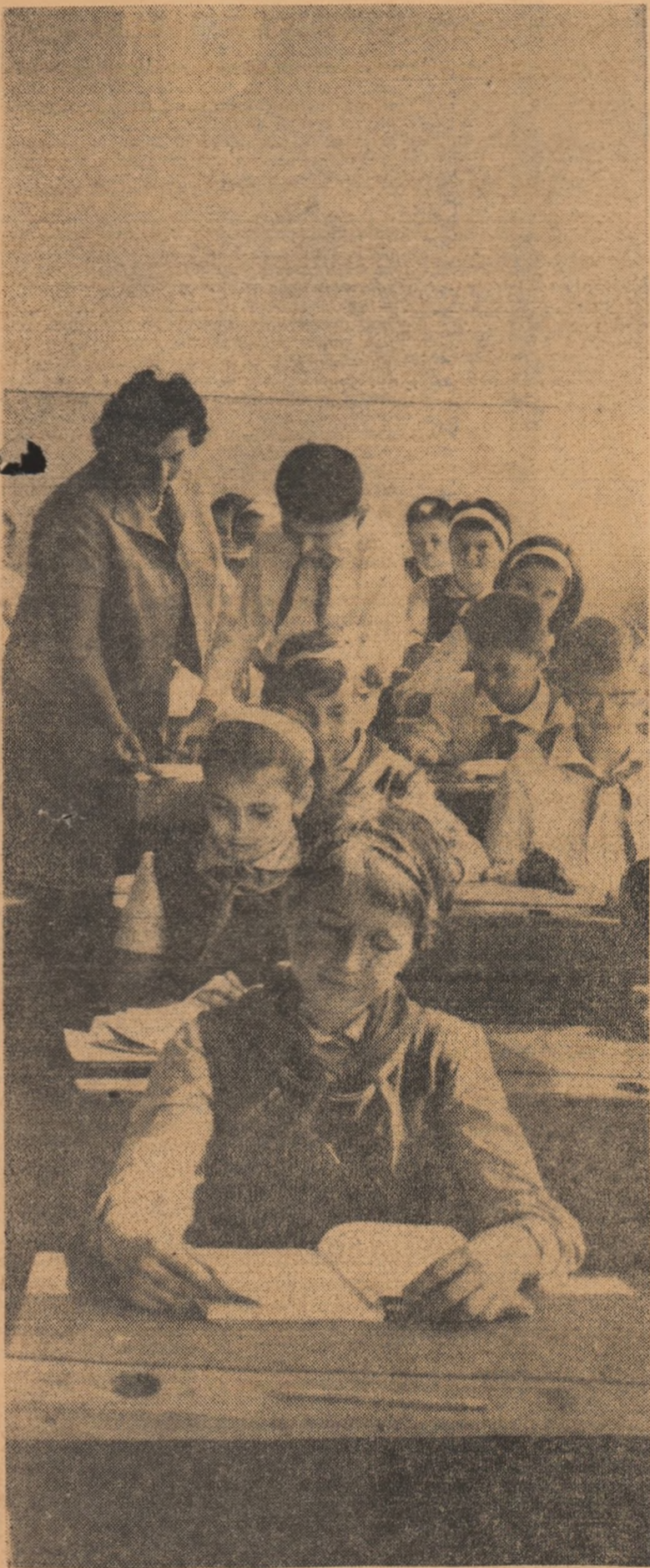
A început o nouă lecție...

Cercul literar al elevilor de la școala medie din Belinț, raionul Lugoj, reprezintă un prețios ajutor pentru munca profesorilor de literatură. Problemele discutate în ședințele cercului, ca de pildă „Povestirea inspirată din trecutul istoric în secolele al XIX-lea și al XX-lea“, „Fabuliști români și universali“, „Romanul în literatura noastră“ etc. stimulează mult dragostea elevilor pentru studiul literaturii. În același timp, discutarea în cerc a lucrărilor originale ale elevilor cu înclinații literare dezvoltă aptitudinile creatoare ale acestora și spiritul lor critic.