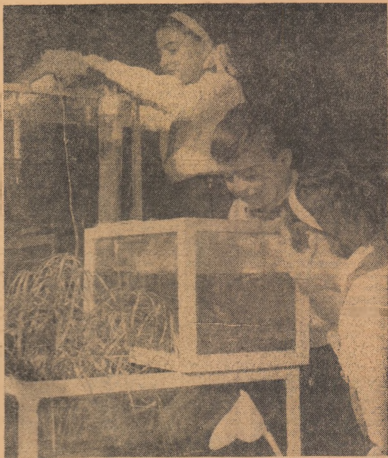
Îngrijind peștii din acvariu (la cercul micilor naturaliști de la Palatul pionierilor din Capitală)

• Educația în spiritul tradițiilor de luptă ale poporului tinde să ocupe un loc tot mai larg în programele școlare din Guineea. În acest scop manualele școlare în pregătire vor cuprinde poeme naționale din secolele al XVIII-lea și al XIX-lea, care povestesc marile fapte ale unor eroi ai luptei poporului pentru eliberare.