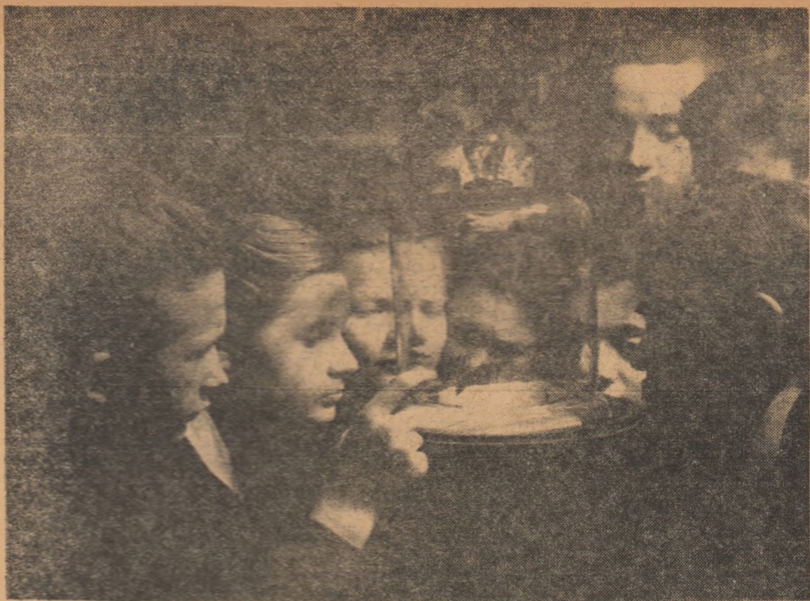
Experiențe în laborator

Sub îndrumarea profesorilor de literatură, membrii cercului pregătesc în prezent materialul necesar alcătuirii unei reviste literare în care vor fi publicate creații originale ale elevilor, precum și recenzii, referate etc.