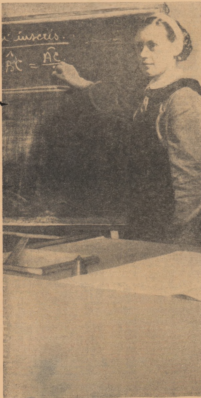
La o oră de geometrie în clasa a VII-a, la Școala de 8 ani din satul Giulești, raionul Fălțiceni.