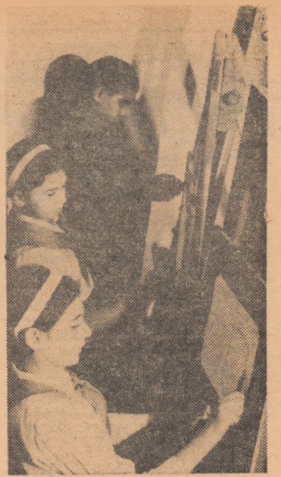
La cercul de pictură de la Casa pionierilor din Roman

Abonamentele se primesc de către factorii poștali, oficiile P.T.T.R. și difuzorii voluntari din școli.