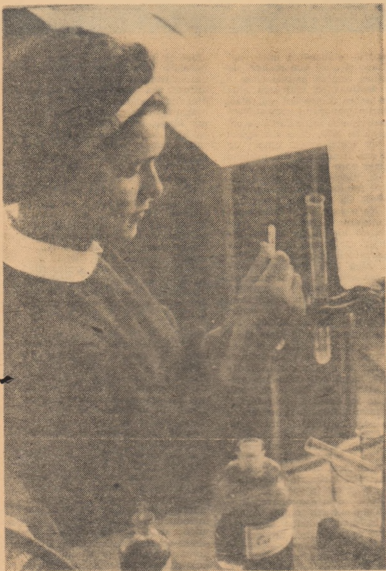
Experiență de chimie în laboratorul Școlii medii nr. 3 din Brașov