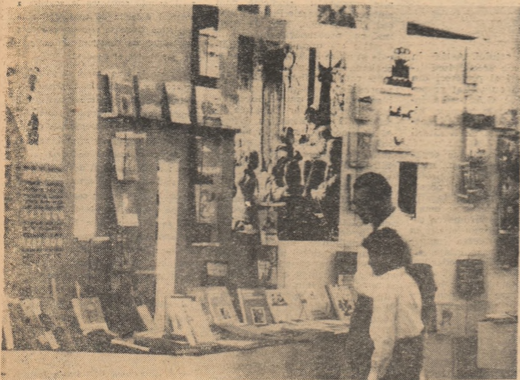
La un stand care ilustrează realizările obținute în domeniul învățămîntului