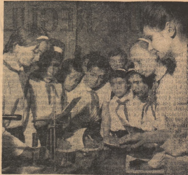
Lecție de fizică în laboratorul Școlii de 8 ani nr. 75 din București

Cunoașterea amănunțită a noilor planuri de învățămînt de către cadrele didactice, înțelegerea principiilor care stau la baza lor, strădania de a aplica în cele mai bune condiții prevederile pe care le cuprind vor contribui în mare măsură la ridicarea nivelului muncii de instruire și educare a elevilor.