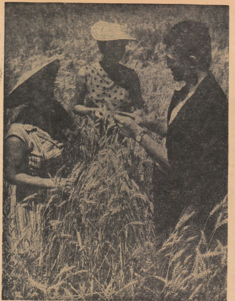
Studentii ai institutelor pedagogice la practică în agricultură

Fiecare succes a fost dobândit printr-o muncă îndelungată, migăloasă și perseverentă, care le oferă acum pedagogilor satisfacția unui bilanț bogat în realizări.