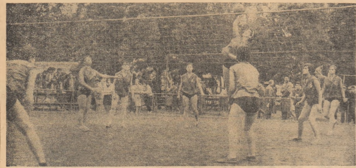
Fază de joc de la finala întrecerilor la volei din cadrul Spartachiadei elevilor