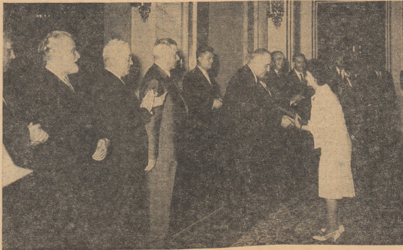
Aspect de la festivitatea înmînării înaltelor distincții acordate cu prilejul „Zilei învățătorului”