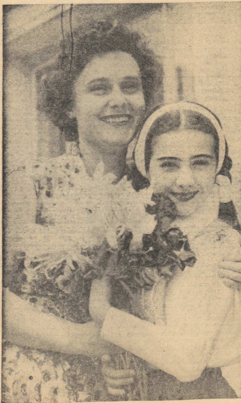
Vă felicit, tovarășă profesoară!