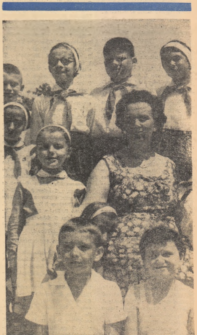
O veșnic nouă fotografie tradițională...