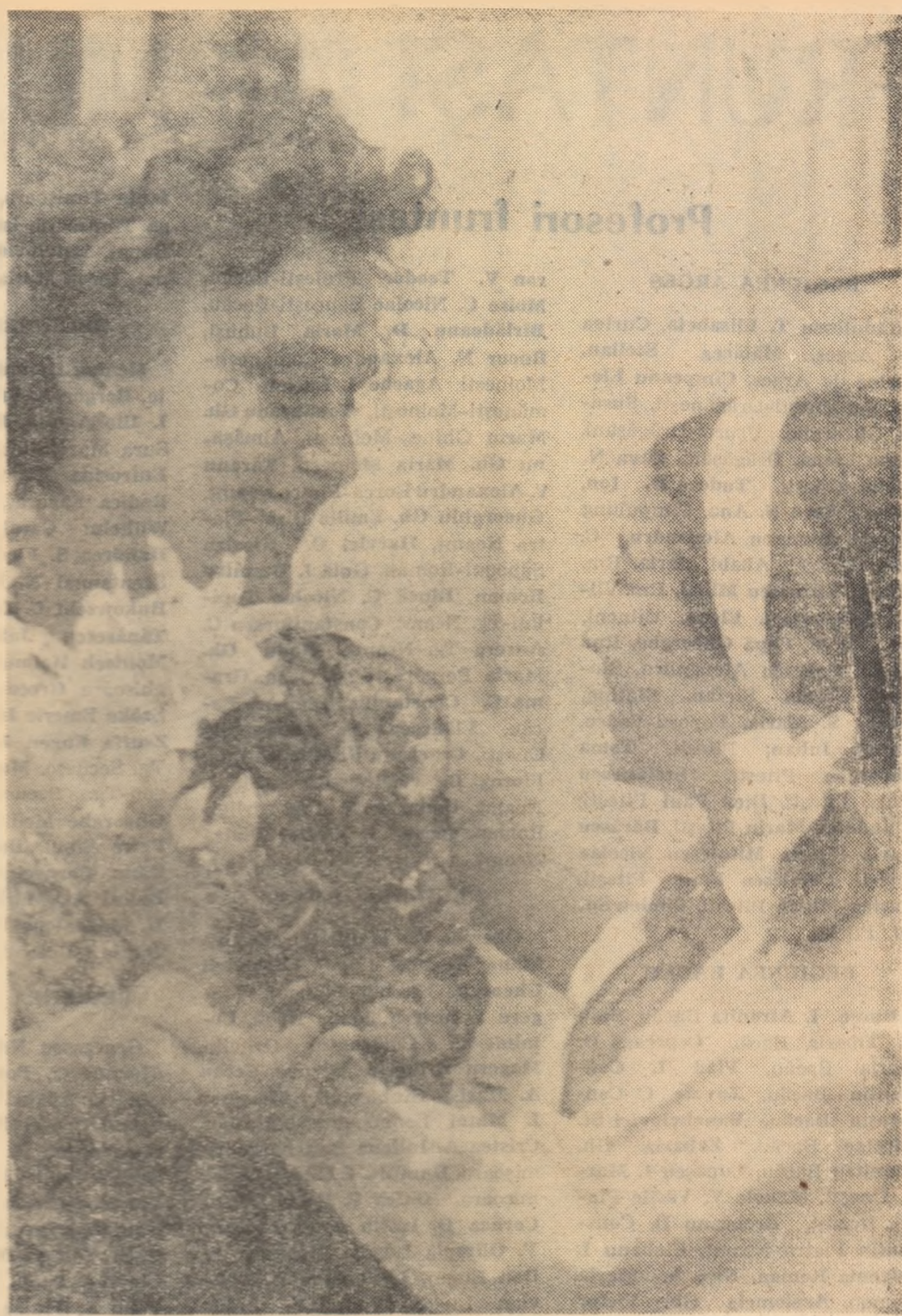
Florile respectului, dragostei și recunoștinței