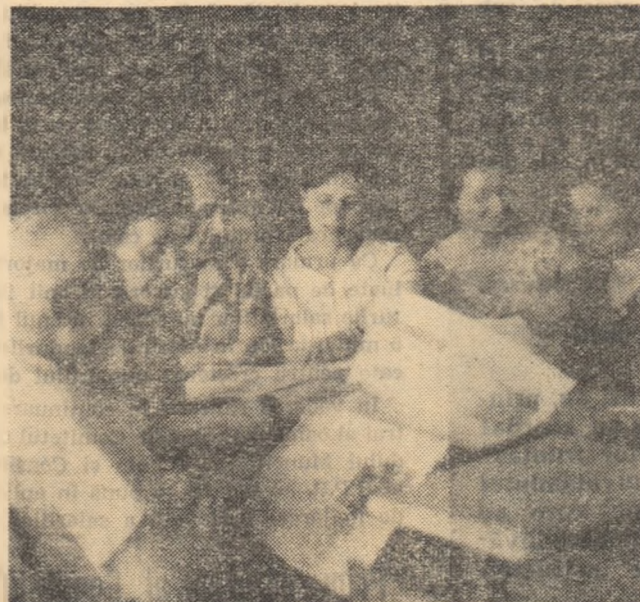
În întreaga țară, profesorii și învățătorii au citit cu bucurie noua Hotărîre a partidului și guvernului.

Reducerea cotelor impozitului pe salarii însumează, la nivelul unui an întreg, 340 milioane lei.