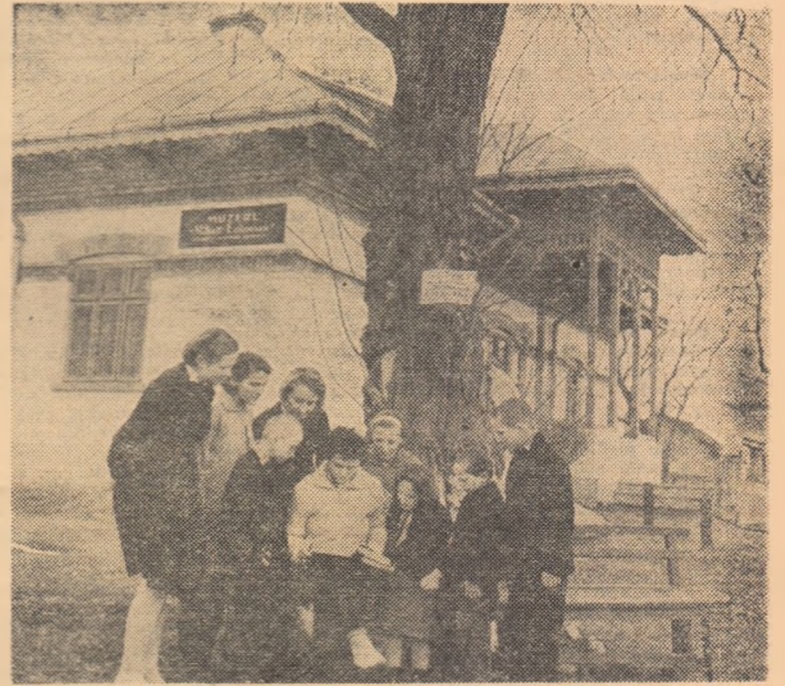
Școlari în vizită la Muzeul „Mihai Eminescu” din Ipotești