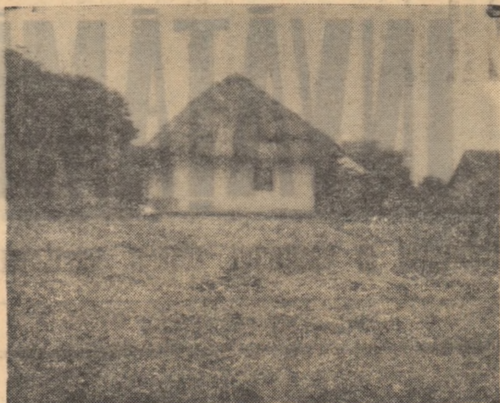
Localul în care a funcționat prima școală primară din Ipotești

Nepăsarea regimului burghez-moșieresc față de cultura maselor populare și prelungita dezinteresare vinovată față de amintirea poetului mort în 1889 se pot urmări și în istoria școlii din satul Ipotești.