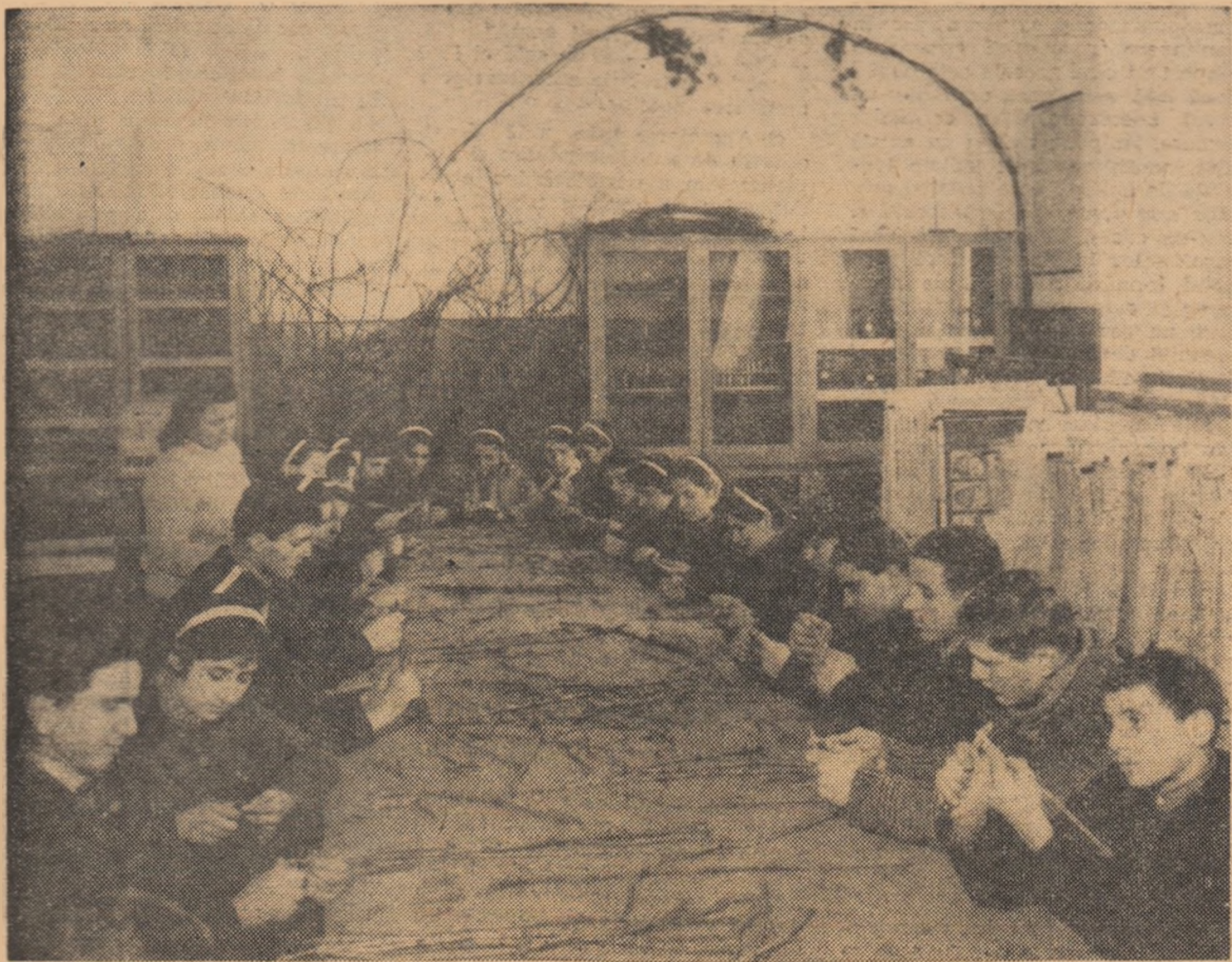
Lecție practică de altoire a viței de vie la centrul școlar agricol din Brăila.