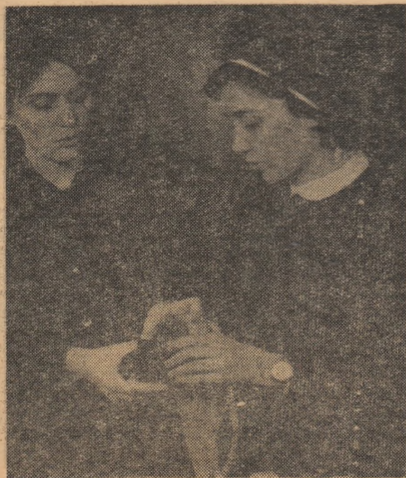
La o lecție de fizică