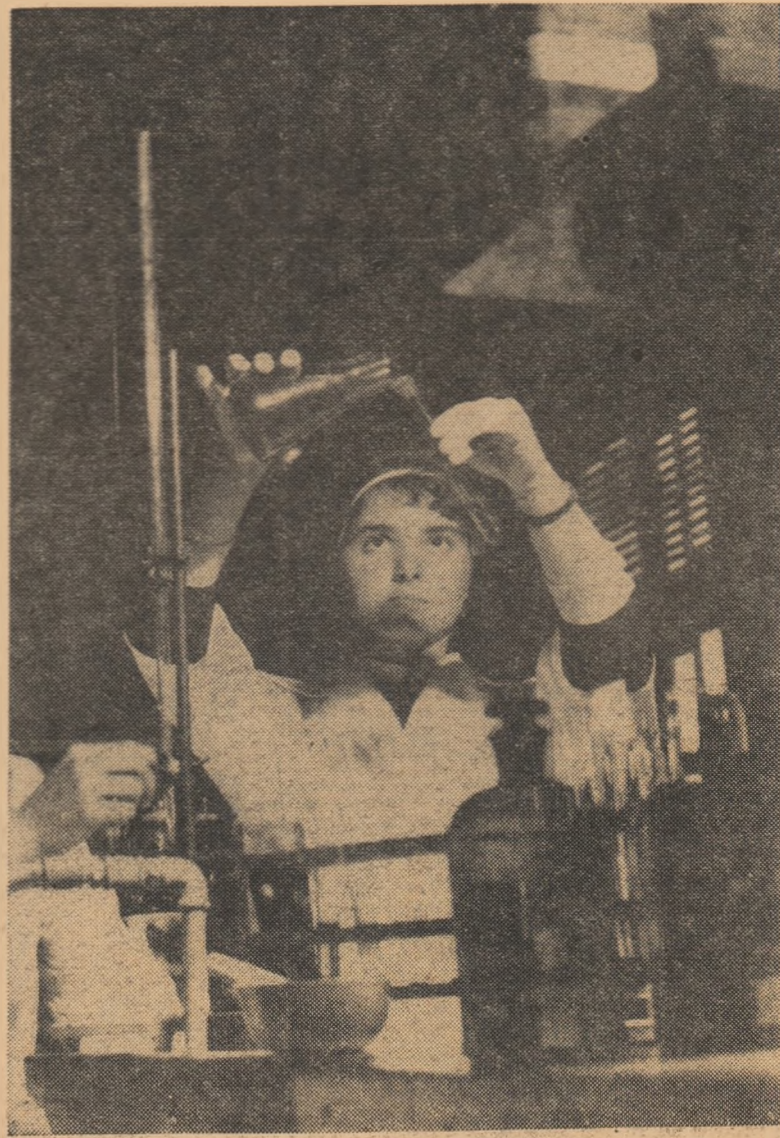
Experiența de chimie în laborator.

Experiența din anii trecuți arată că în etapa dinaintea examenului de maturitate cei mai mulți candidați sînt tentați să se „închidă în casă” și să învețe și iar să învețe, astfel încît în ziua examenului sînt complet extenuați. La aceasta contribuie și părinții care îi obligă să muncească intens zi și noapte. În perioada dinaintea examenelor foarte puțini tineri lasă cartea ca să vină la școală pentru consultații, pierzînd astfel prilejul de a-și clarifica lucrurile pe care singuri nu le pot elucida. De aceea, este necesar ca acum, în perioada sintezelor, să îndrumăm pe elevi și pe părinți în vederea unei organizări a studiului individual, astfel încît în 6 iunie copiii să fie cu toată materia parcursă și adîncită. Săptămîna care îi desparte de examen să fie rezervată doar pentru o trecere în revistă a problemelor și pentru mai buna precizare a lor cu ajutorul consultațiilor organizate, cu mare atenție, de către școală.