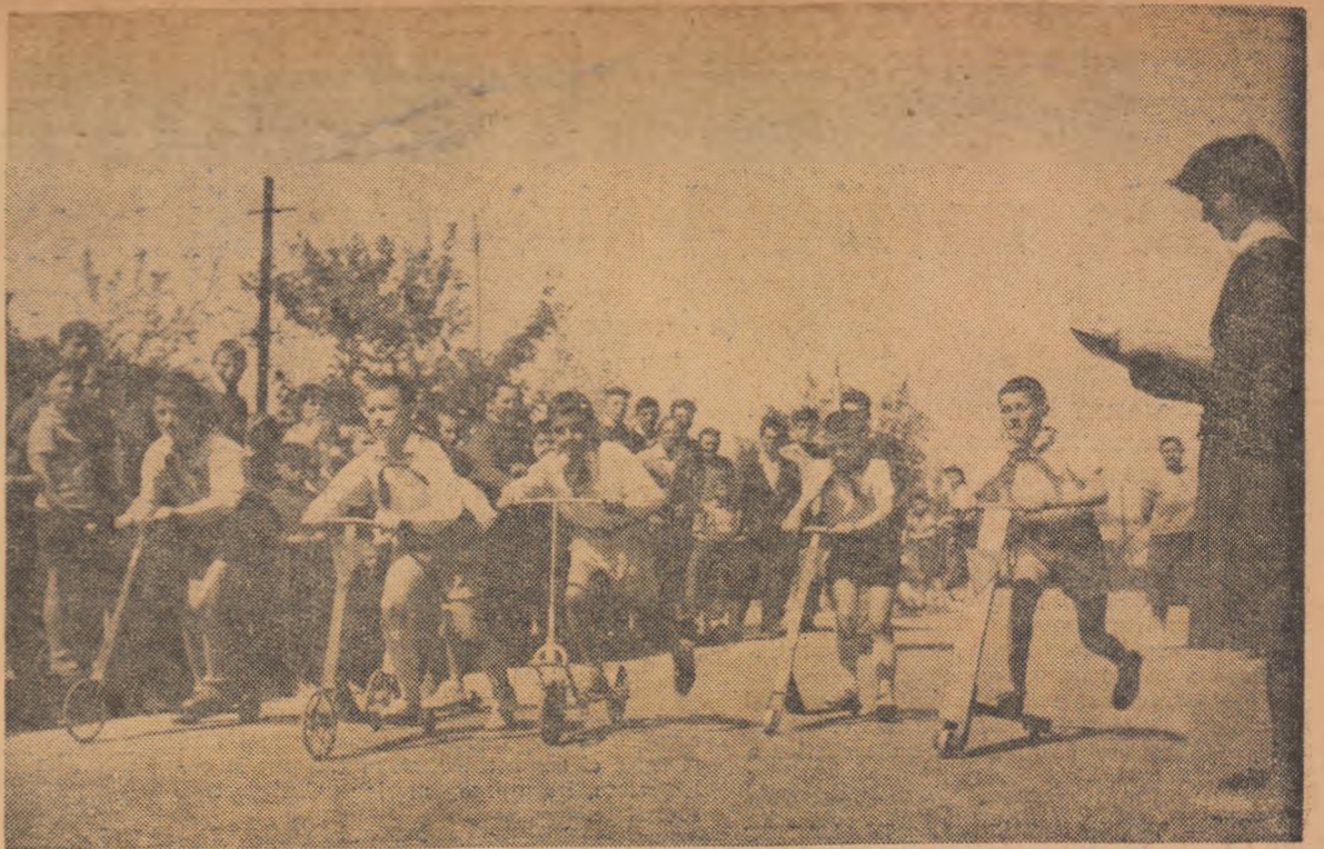
Concurs de trotinete între pionieri și școlari.