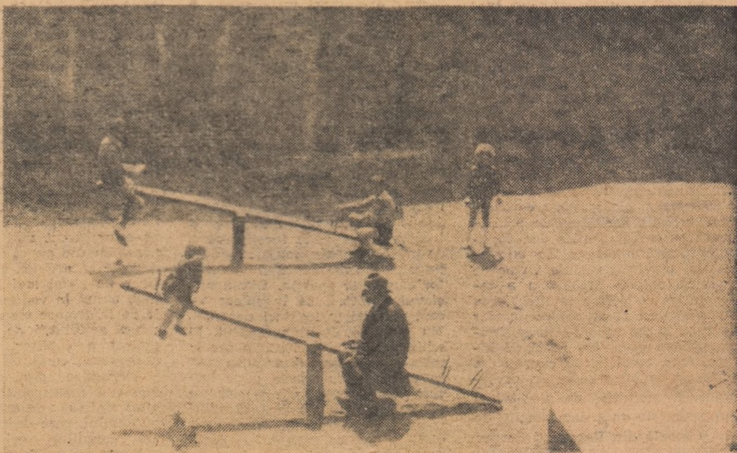
Bunicul și nepotul

Peste tot pregătirile pentru vacanță sînt în toi. Cu grijă, cu dragoste, zeci și zeci de pedagogi muncesc, se străduiesc să asigure elevilor, după un an de muncă, odihna binemeritată, zile frumoase, bogate în bucurii.