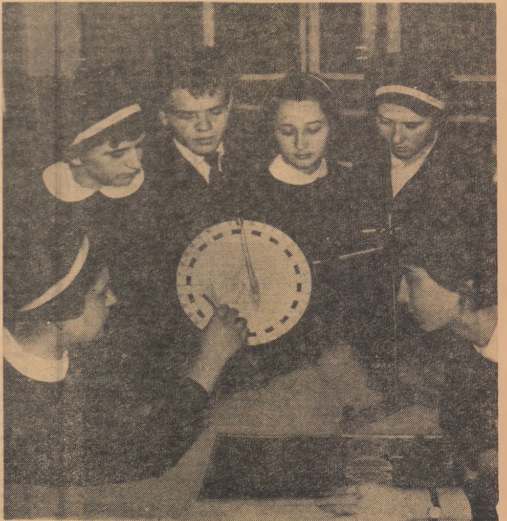
Recapitulind o temă de optică — în laboratorul de fizică al Școlii medii nr. 2 din orașul Bacău.

★ Acestea sînt indicații de bibliografie minimă. Se recomandă cadrelor didactice să studieze articolele care apar în presa de partid — „Scinteia”, „Lupta de clasă” — și materiale care apar în Editura Politică.