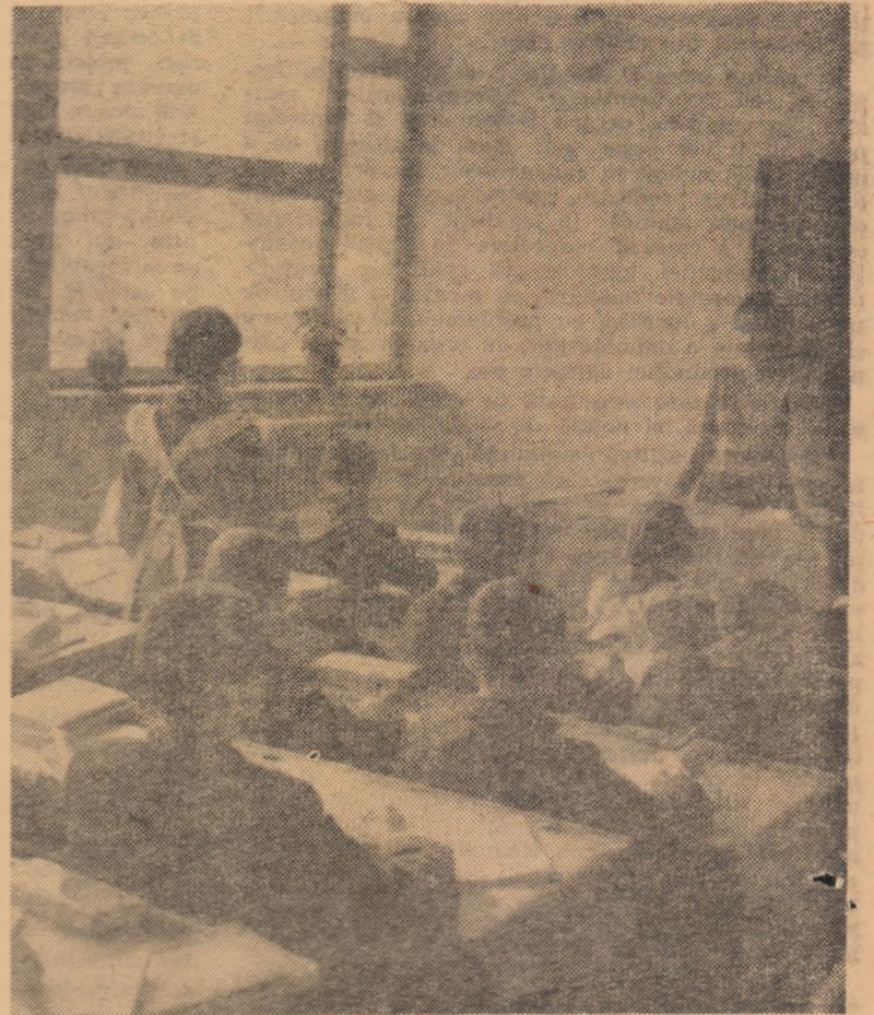
Lecție la clasa a IV-a

a) Nota — criteriu de autoafirmare: „Cînd primesc o notă rea învăț mai bine ca să mă îndrept și să mă laude tov. profesor... să mă facă și pe mine pionier... notele