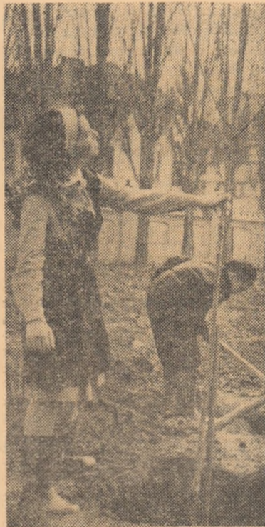
La plantarea puieților

Pentru toți participanții la sesiune lucrările acestora au constituit un prilej de bogată și variată informare științifică, stimulindu-le interesul pentru munca de cercetare științifică pe probleme de specialitate și metodice.