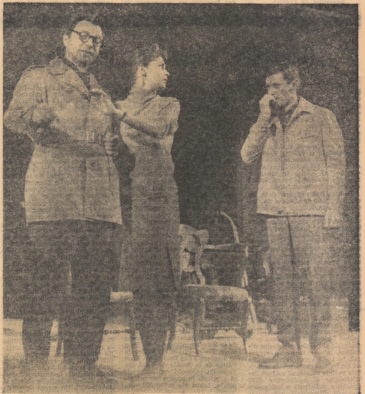
Scenă din spectacolul „Noaptea e un sîrmeț bun” prezentat de Teatrul „Lucia Sturdza Bulandra” din Capitală.