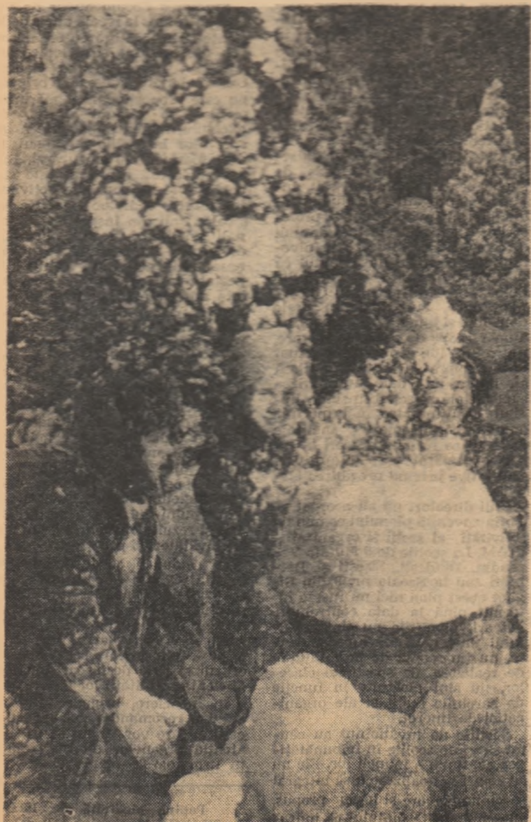
Zăpada adaugă jocurilor o nouă și mare bucurie