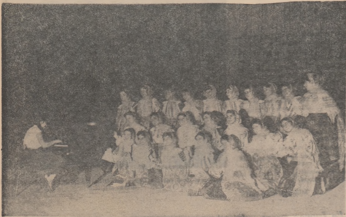
Ansamblul artistic al Școlii medii „Aurel Vlaicu” din Capitală pe scena Casei de cultură a tineretului „Vasile Roaită”