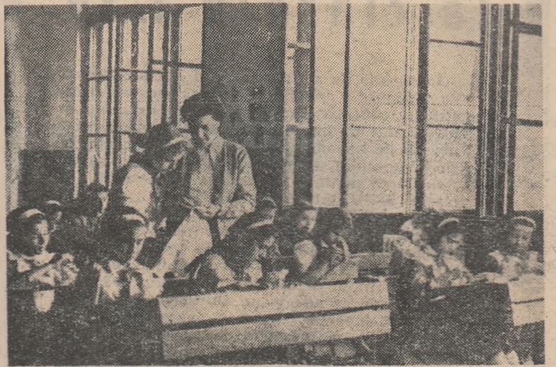
Artă și îndemnare