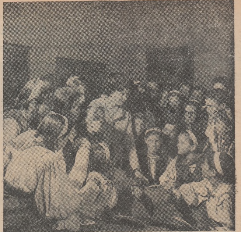
La Școala de 8 ani din Drăgușeni. Ultimele sfaturi înaintea șezătorii literar-artistice