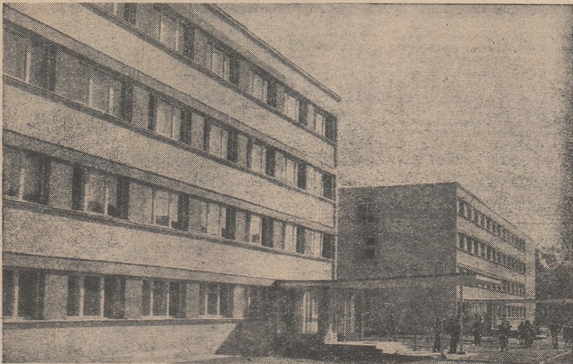
Noul cămin al Institutului pedagogic de 3 ani din Craiova oferă condiții dintre cele mai bune viitorilor profesori