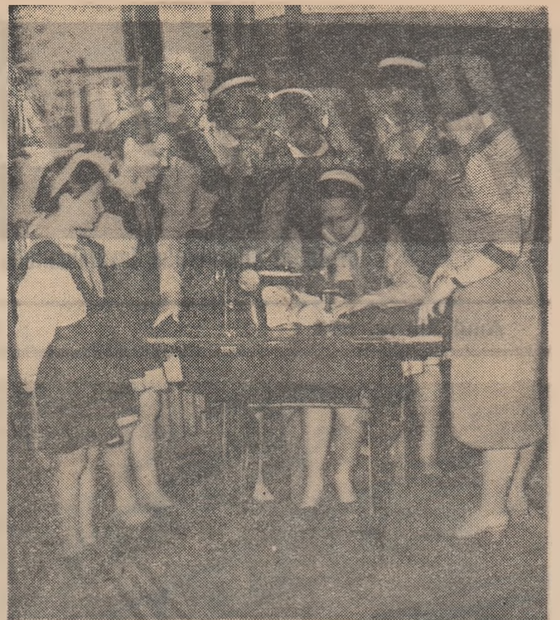
Lecțiile practice la mașina de cusut plac mult elevelor de la Casa de copii „Olga Bancic” din Buzău

Pregătite și organizate temeinic, adunările de dări de seamă și alegeri în grupele sindicale vor duce la o și mai largă mobilizare a cadrelor didactice în vederea traducerii în viață a sarcinilor de mare răspundere ce le-au fost încredințate de partid, vor duce la ridicarea pe o treaptă superioară a muncii din grupele sindicale.