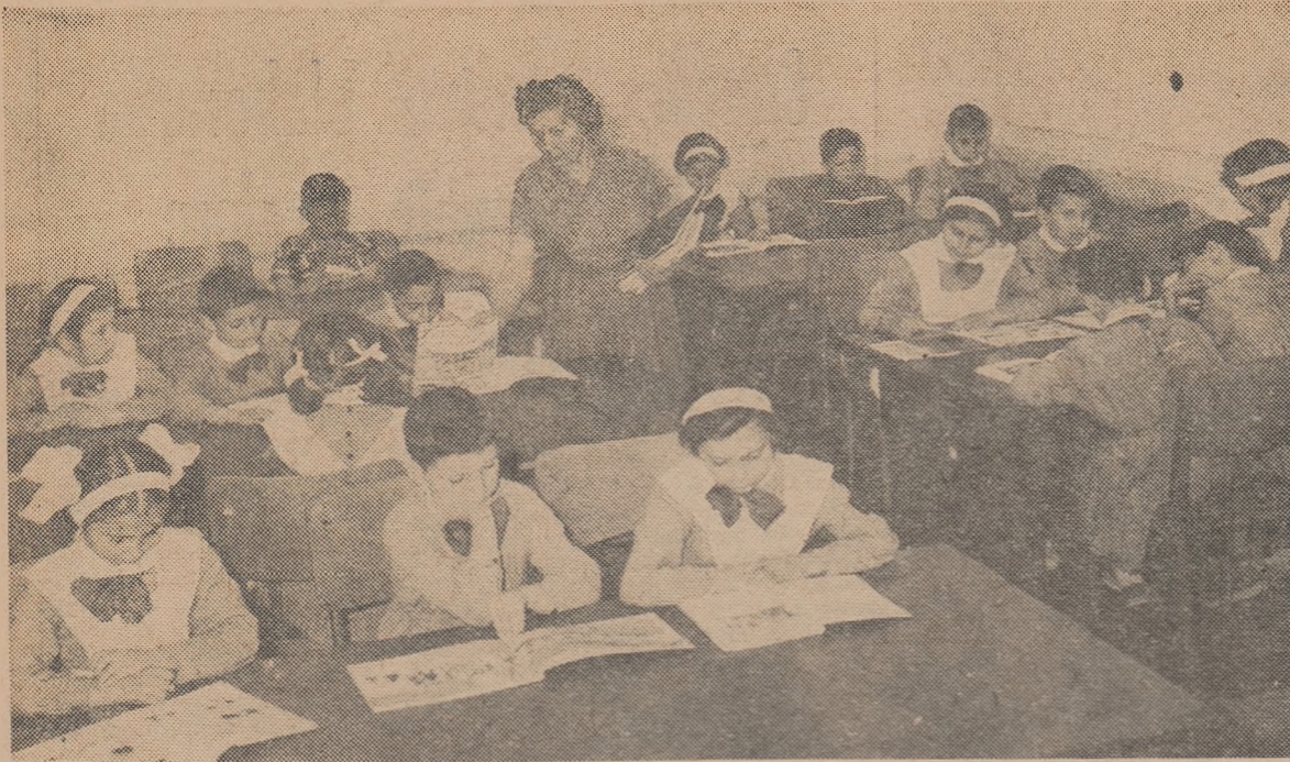
In sala de lectură pentru copii a Bibliotecii centrale, micii cititori care au îndrăgit cărțile vin în număr tot mai mare