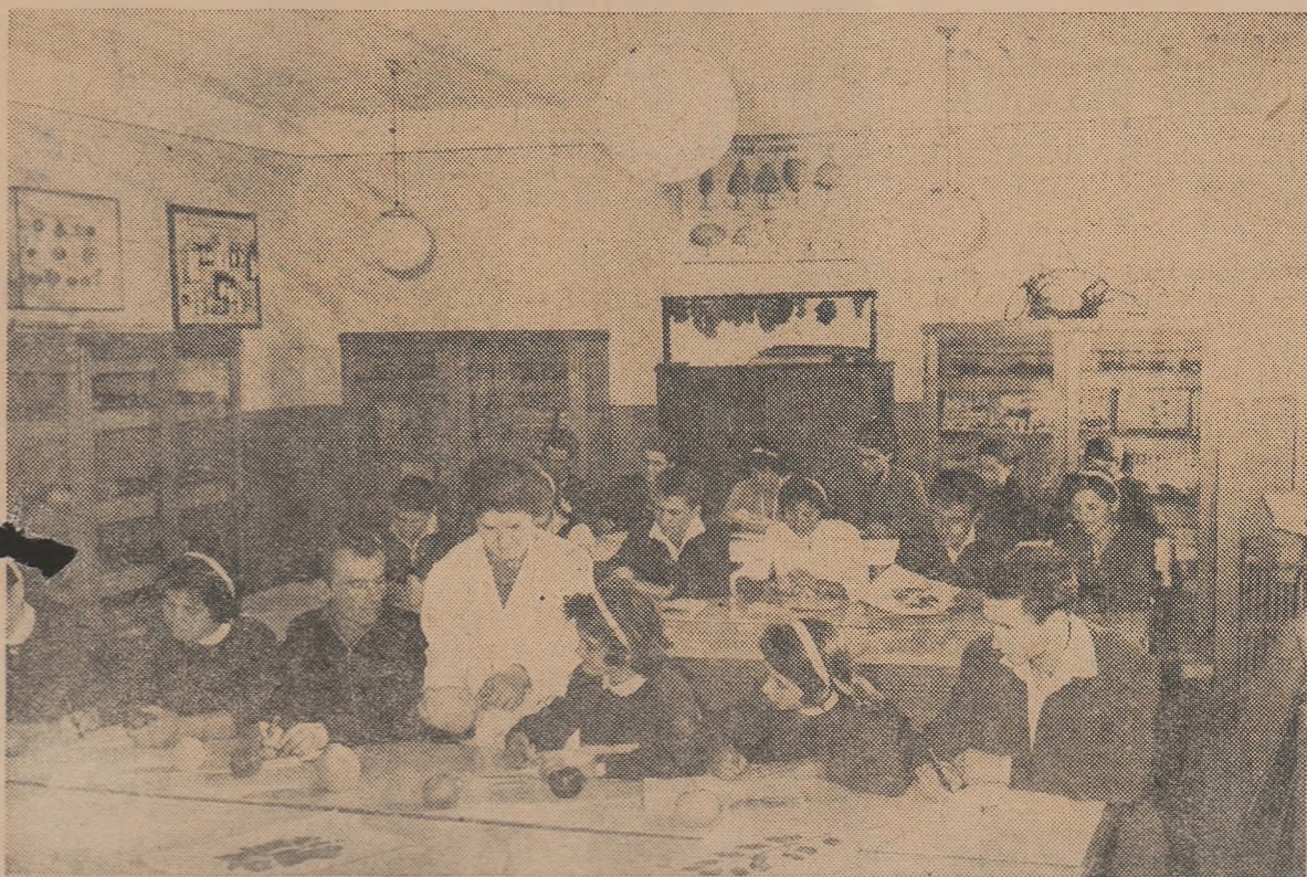
Elevii anului II ai Școlii tehnice horticole din Tirgșorul Nou, regiunea Ploiești, la o lecție practică de pomologie