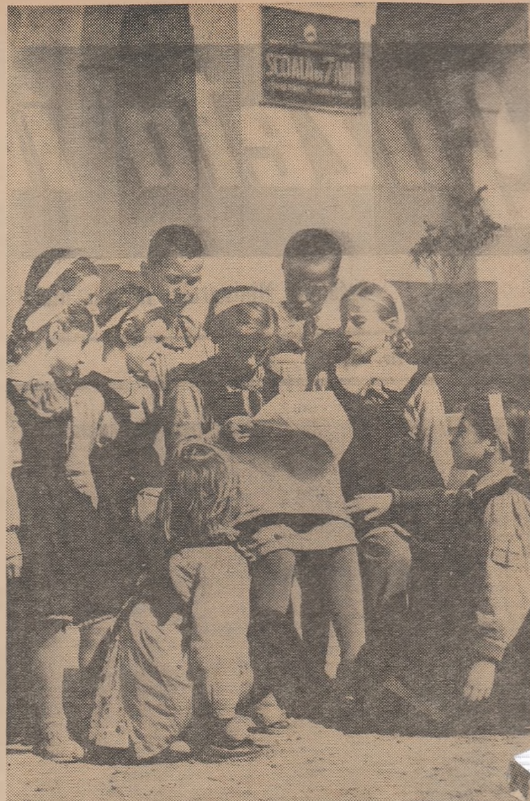
Atenția elevilor este reținută de lecturile interesante pe care le găsesc în „Știința pionierului”

Bogat ilustrat cu fotografii, scheme și desene — numărul 1 al revistei „Învățămîntul profesional și tehnic” constituie pentru profesorii și maștrii-instructori din învățămîntul profesional și tehnic un real sprijin în activitatea didactică, iar pentru viitorii muncitori și tehnicieni o lectură interesantă și atractivă. „Gazeta învățămîntului” urează colectivului redacțional al noii publicații, care întregeste frontul presei pedagogice din țara noastră, spor la muncă și succes în importanta activitate căreia îi