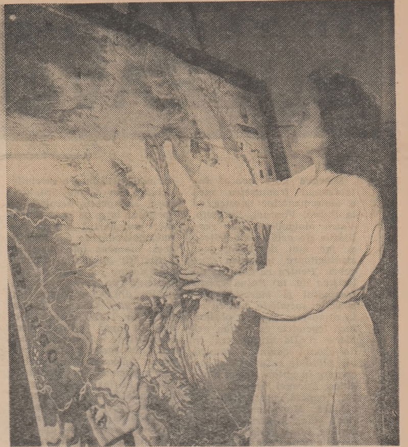
Cu grijă și atenție la I.M.D. hărțile sînt revizuite înainte de a fi trimise în școli

Școala medie nr. 36 are o clădire nouă, construită doar de cîteva ani. Profesorii și elevii acestei școli au toate condițiile pentru a desfășura o muncă rodnică. Laboratoarele școlii dispun de material modern. Școala are sală de festivități și sală de gimnastică, de asemenea utilizate după ultimul cuvînt al cerințelor pedagogiei științifice. Din păcate, grija conducerii școlii pentru folosirea materialului didactic modern cu care a fost înzestrată aceasta lasă de dorit. Astfel, în 1960 au fost trimise acestei școli două aparate de proiecție în valoare de peste 56.000 lei. De atunci ele zac neutilizate în magazie. Directorul școlii, tov. Mihai Vasiliu,