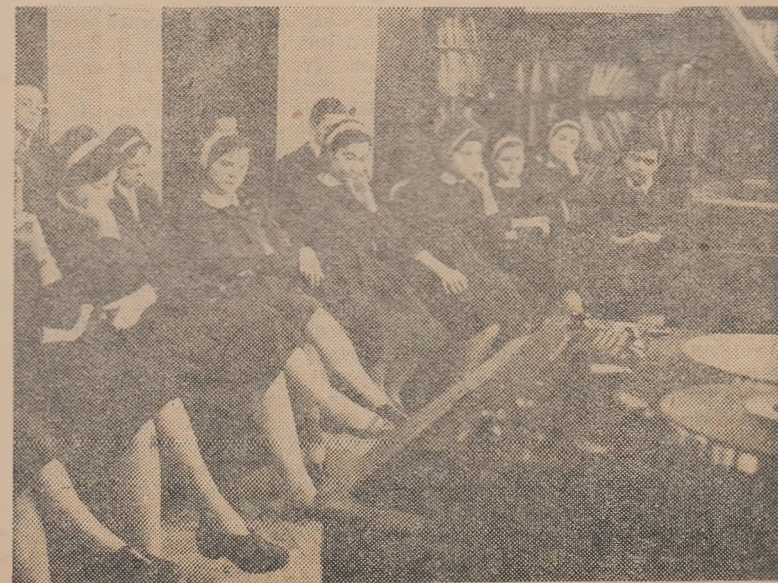
În timpul liber elevii claselor a XI-a de la Școala medie nr. 28 din București participă la audițiile muzicale organizate în școală

Librăria dispune de un bogat sortiment de cărți tehnico-științifice, de literatură clasică și contemporană etc. Pentru a vă ajuta la întocmirea comenzilor librăria trimite gratuit, la cerere, materiale de informare bibliografică.