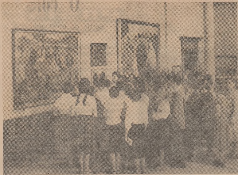
In vizită la Galeria de artă R.P.R.

Cadrele didactice care, din motive bine întemeiate, n-au depus lucrările personale la institute în termenul stabilit prin regulamentul, le pot înainta până cel mai târziu la data de 10 noiembrie a.c. Lucrările trimise după această dată nu vor mai fi luate în considerare.