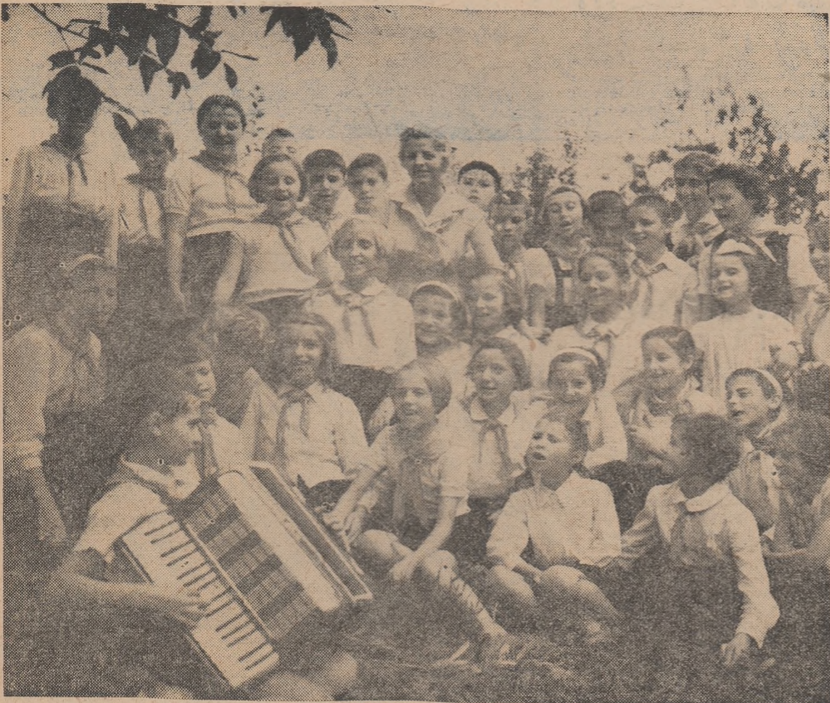
Popas in drumetie