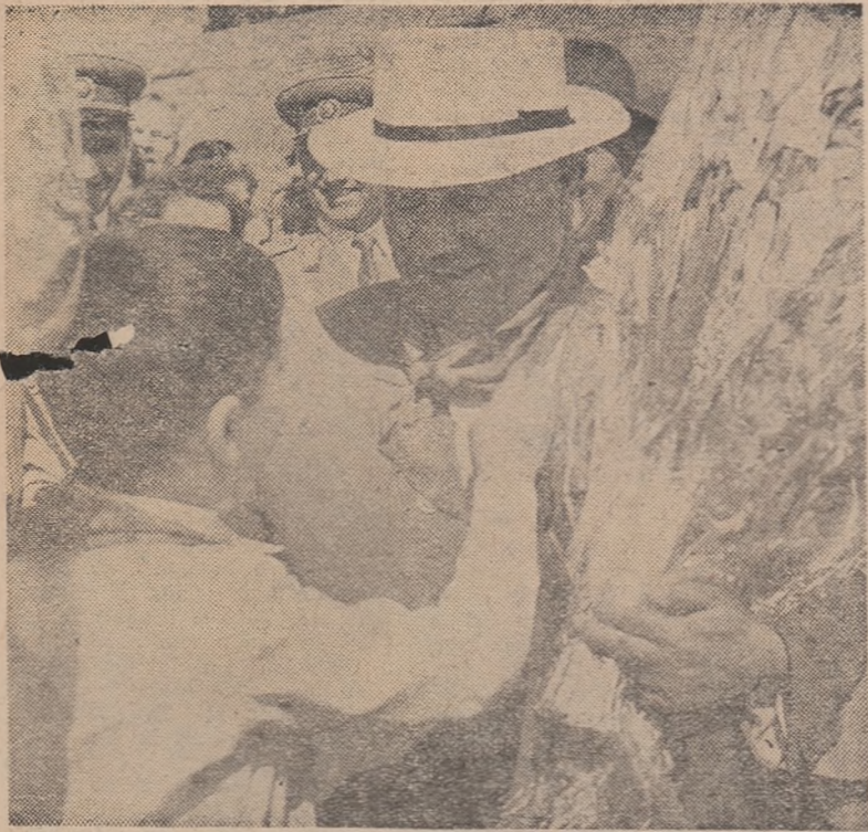
Alături de întregul popor, pionierii au întâmpinat cu bucurie delegația de partid și guvernamentală a Uniunii Sovietice, în frunte cu tovarășul Nikita Sergheevici Hrușciov.

Luni, 18 iunie, dimineața, a sosit la București delegația de partid și guvernamentală a Uniunii Sovietice, condusă de tovarășul N. S. Hrușciov, prim-secretar al C.C. al P.C.U.S., președintele Consiliului de Miniștri al Uniunii Sovietice.