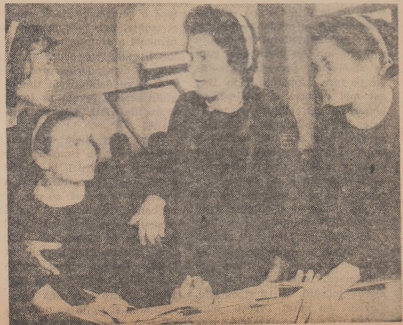
Consultările reciproce sînt întotdeauna rodnice.