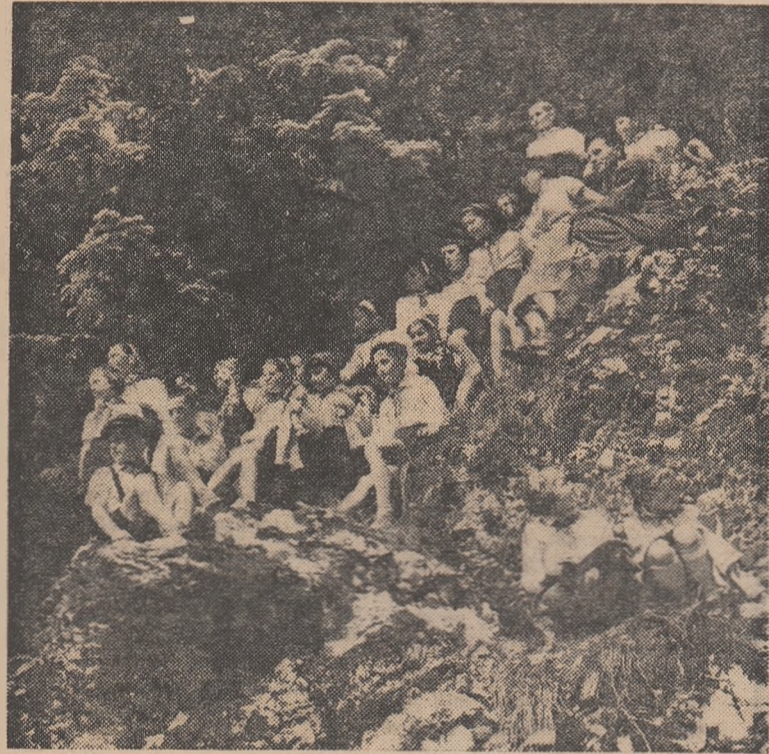
In excursie la Sinaia

În vacanța de iarnă și în cea de primăvară, corul cadrelor didactice din raionul V. I. Lenin a făcut o vizită la Piatra Neamț și respectiv la Sibiu. Cu acest prilej între coriștii bucureșteni și cei din Sibiu și Piatra Neamț a avut loc un schimb de experiență. De „Ziua Învățătorului” cele trei coruri ale cadrelor didactice și-au dat întîlnire la București unde, în seara zilei de 30 iunie, vor prezenta împreună un concert în sala Teatrului C. C. S.