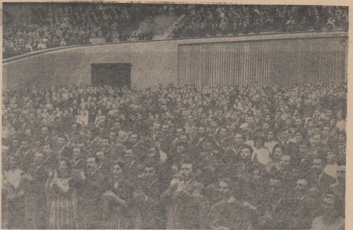
La adunarea festivă a tineretului

Trăiască inițiatorul și organizatorul tuturor victoriilor, conducătorul înțelept și încercat al întregului popor în lupta pentru victoria deplină a socialismului — Partidul Muncitoresc Romîn! (Întreaga asistență în picioare ovacionează și aplaudă îndelung).