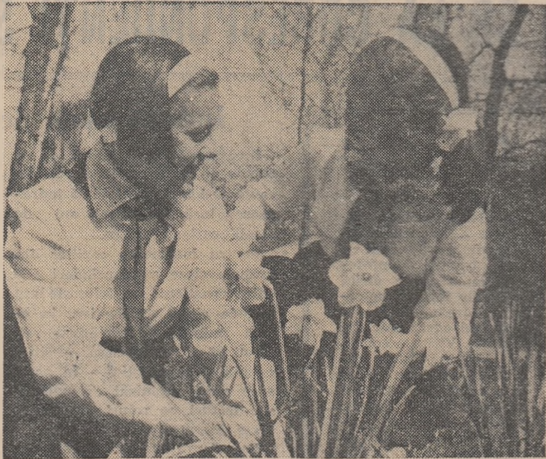
Flori de primăvară

(din revista „Sovetskaja Pedagogika” nr. 2/1962)