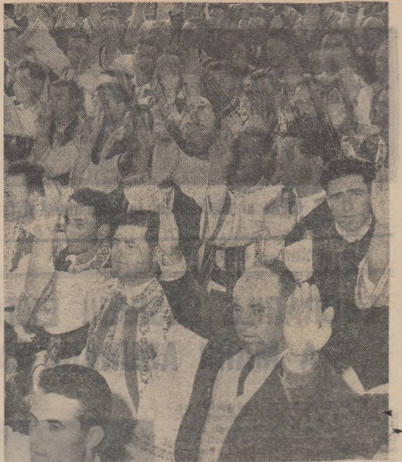
Participanții la Sesiunea extraordinară a Marii Adunări Naționale votează în unanimitate hotărîrea adoptată cu acest prilej

Școlile de maiștri mecanici vor trebui să asigure ca în 1970 să existe cite un maestru la fiecare secție și atelier de reparații la gospodăriile de stat, iar la stațiunile de mașini și tractoare cite unul la fiecare 50 de tractoare.