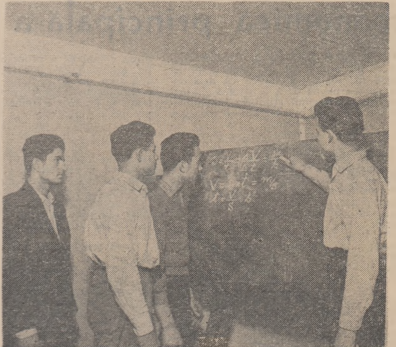
Elevii ai școlii serale, petroliștii de la schelele din Bălteni dovedesc în rezolvarea problemelor de fizică aceeași pricepere ca și în munca de extragere a lîjeiului