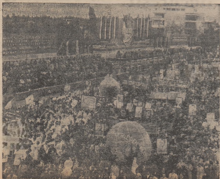
Aspect de la demonstrația oamenilor muncii în ziua de 1 Mai