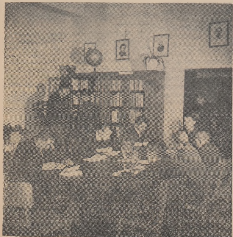
La bibliotecă e liniște și totul în jur parcă te îndeamnă la studiu. De aceea elevii grupului școlar „Electroputere” din Craiova vin deseori să învețe aici