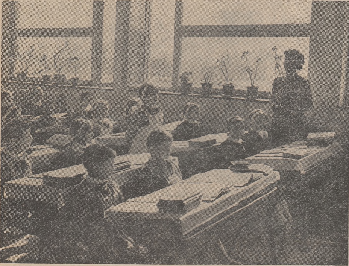
Ordonanți, atenți, cuminți — așa sînt elevii clasei I de la Școala de 8 ani nr. 166 din București