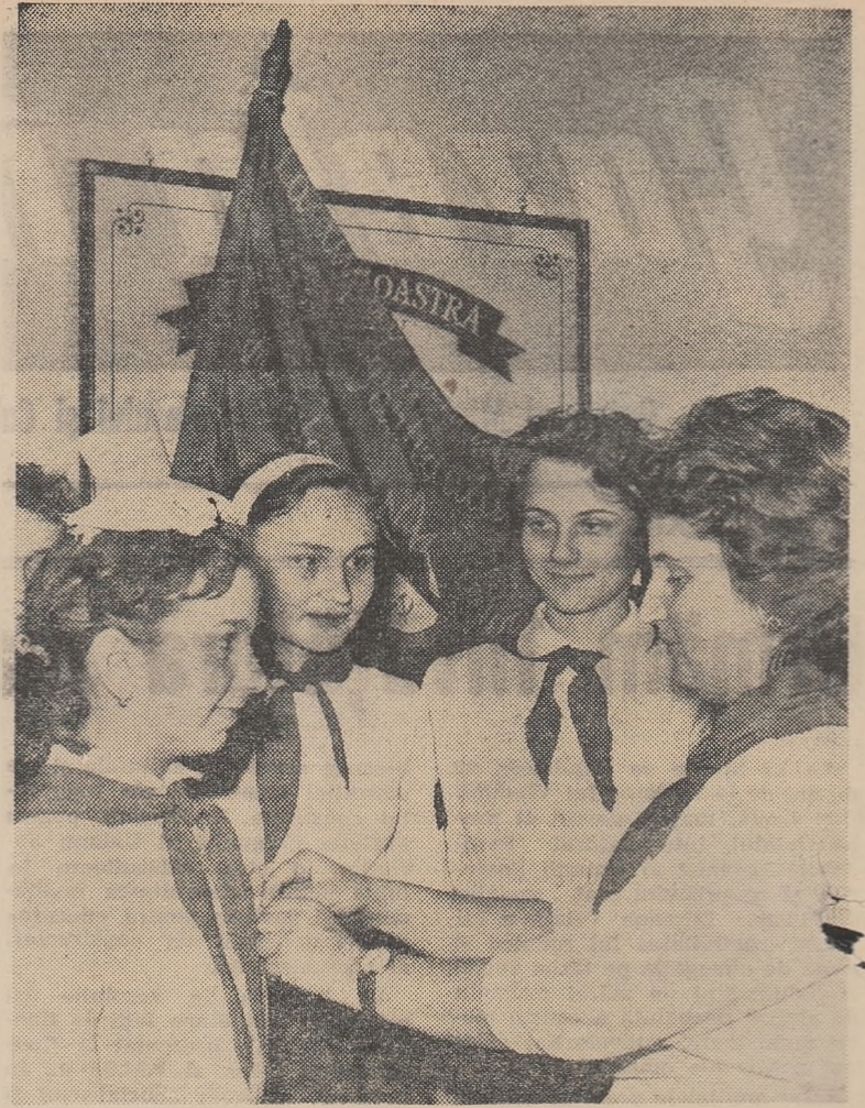
Primirea distincției pionierești — o sărbătoare pentru fiecare pionier din patria noastră.