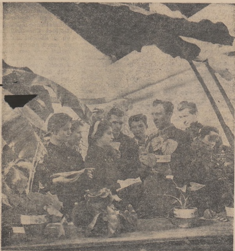
Elevii Școlii profesionale agricole din Fălticeni în practică la sara Stațiunii experimentale horticoale din localitate