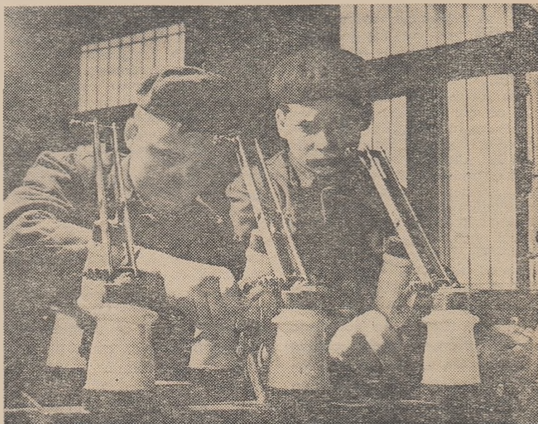
Montarea unui separator tritaxic în cadrul practicii de specialitate în atelierul-școală al Centrului școlar de construcții din București